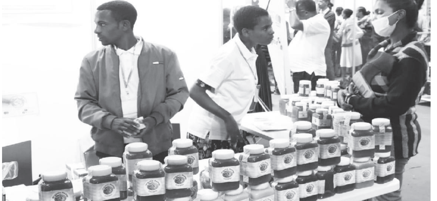
በንብ ማኑስ በማህበር የተደራጁ ወጣቶች እሴት የተጨመረበት የማርና ሰም ምርት ለገበያ እየቀረቡ ይገኛሉ።

ሥራ ከገቡ ሁለተኛ አምራቾች ይዘዋል፤ ውጤታቸውን ለማየት ጓጉተዋል። እስካሁን ባለው ተሞክሮ የማር ልማቱ በአመት ሁለቱ ነው የሚከናወነው። እነሱም በሀዳርና በግንቦት ወራት ስለት መቶ ኪሎ ግራም ማር አምርተዋል። ይህን ሥራ በማሳደግ ከዚህ በላይ በማምረት ገበያውን ለመያዝ እየሰሩ ናቸው። ምርቱን ለማሳደግ ጥራት ያለው ማር ለማምረት ንቦችን በተገቢው መንገድ መንከባከብ፣ የአካባቢ ጉዳዩን መጠበቅ፣ የሚቀስሟቸውን እጭቶች በስፋት መትከል ይጠበቃል። ይህን ማሟላት ከተቻለ ንቦች ከፍተኛ የማር ምርት መስጠት እንደሚችሉ በአንድ አመት የንብ ማኑስ ሥራ ተሞክሮ አግኝተዋል።