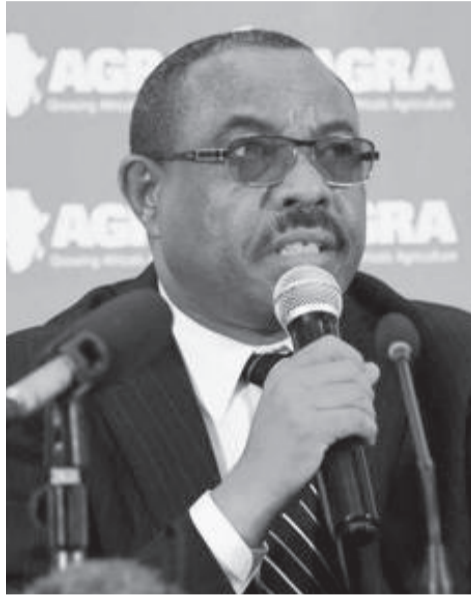
የቀድሞው የኢትዮጵያ ጠቅላይ ሚኒስትር ኃይለማርያም ደሳለኝ ትኩረቱ የዘር አጠቃቀም ሥርዓትን በማሻሻል፣ የመንግሥት ተሳትፎን በማሳደግ፣ የግብርና ግብዓት

አቅርቦት ሰንሰለት እና የአየር ንብረት ለውጥ ችግሮችን በመቅረፍ ላይ እንደሚሠራም ነው የተገለፀው።