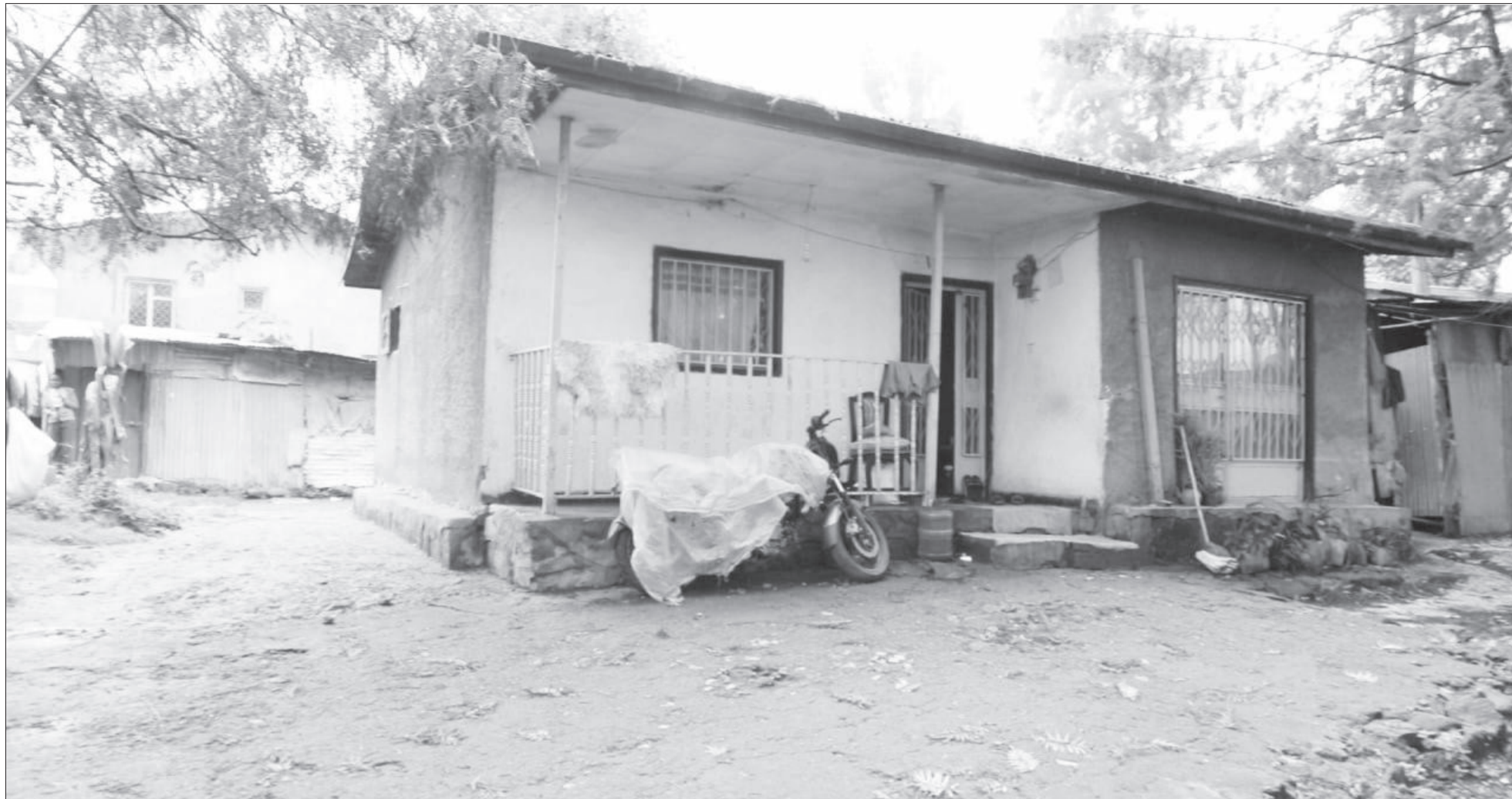
በገፍ በ550 ሺ ብር ሲሸጥ የነበረው ደሃ ቤት 11 ነጥብ ሰባት ሚሊዮን ብር ስውጥቷል።