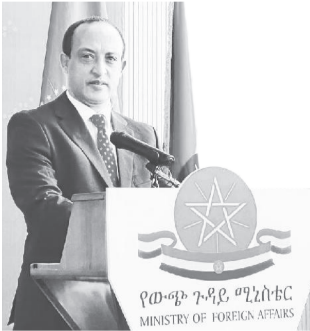
አምባሳደር መለስ ዓለም

ግንኙነት በማድረግ የሁለትኛው ወይይቶች እንደነበሩ ጠቅሰው፣ 20 የሚሆኑ ወይይቶች መደረጋቸውን አንስተዋል።