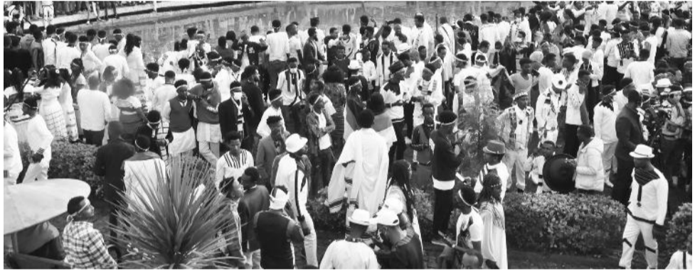
የክዲስ አበባ የ2014 ዓ.ም የክሬቻ በዓል አከባቢ

በፈጣሪና በፍጥረት መካከል ያለውን መስተጋብር የሚያጠናክር የገዳ ሥርዓት ፍልስፍና አካል ሲሆን፤ የኢትዮጵያውያን ሁሉ የጋራ ሀብት፣ የጋራ እሴት፣ የጋራ ቅርስ ነው።