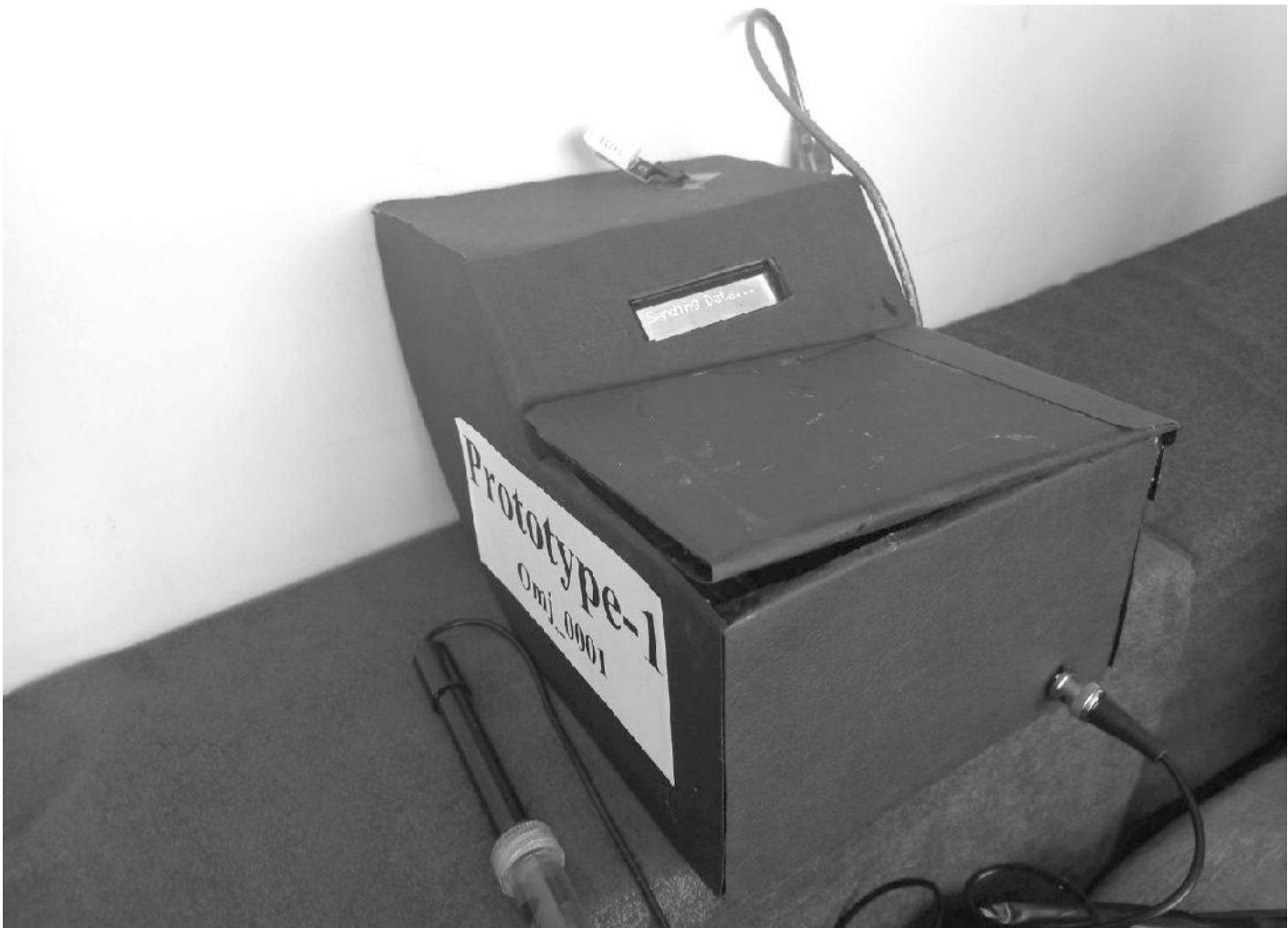
የአፈር ምርመራ ያሳይ የሥራ ውጤት በአንድ ስካን ዘር ከመዘራቱ በፊት አፈር ለየትኛው የዘር ዓይነት ምቹ እንደሆነ በመለየት የምርት ውጤትን ከፍ ለማድረግ ያግዛል።

የቤቷ ስካን (CT Scan) ምስሎችን ተቀብሎ የኮርና ቫይረስን መለየት የሚችለው የፈጠራ ውጤት ደግሞ «ደቦ ኢንጂነሪንግ» በጤናው ዘርፍ ካበለፀጋቸው ቴክኖሎጂዎች መካከል አንዱ ነው። ይህ ቴክኖሎጂ መረጃዎችን ከምስሎቹ ወስዶ በመተንተን አንድ ሰው በኮርና ቫይረስ መያዙንና አለመያዙን ያሳውቃል። ከዚህ በተጨማሪም የወጣ በሽታ አምጭ ትንሽ ዝርያን ለመለየት የሚያስችል ቴክኖሎጂም ሰርቷል።