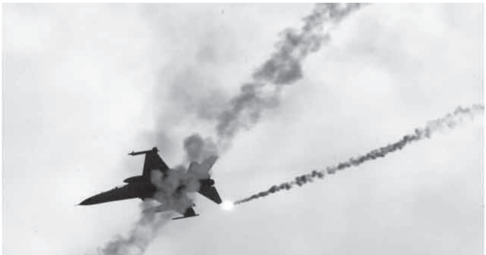
ታይዋን በቅርቡ ወታደራዊ ልምምድ አድርጋለች