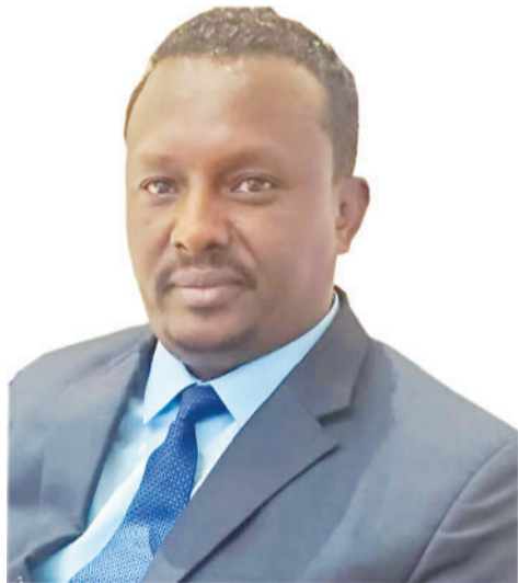
አት ገመጽስ መላኩ