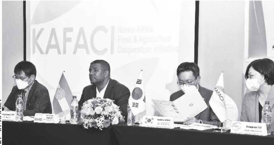
ይቶ - በሃዲስ አበባ

ትብብር በአፍሪካና በደቡብ በኮሪያ መካከል ያለውን ወዳጅነት ለማጠናከር ወሳኝ ነው ያሉት አምባሳደር ካንግ፣ የግብርናው ዘርፍ ማዘመን አስማማች የኢኮኖሚ አድገት ያመጣል። ለደቡብ ለኮሪያ ዕድገት መሰረቱ በ 1970 ዎቹ