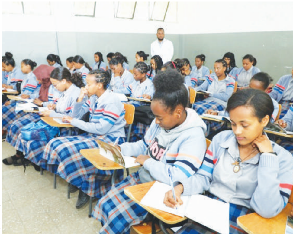
የኦፊሽል መሪዎች የደጋፊዎች አዳሪ 2ኛ ደረጃ ትምህርት ቤት ተማሪዎች በትምህርት ገበታ ላይ

በትምህርት ቤቱ ቅጥር ጊቢ ተማሪዎች የሚጠበቅባቸውን ተግባራት፣ ትምህርታቸውን በምን መልኩ መከታተል እንደሚገባቸው፣ እንዲሁም አዲስ የሚጀመሩ ትምህርቶች በምን መልኩ መከታተል