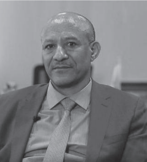
አቶ ተመስገን ጥሩኑህ

በመልዕክታቸው ኢትዮጵያ ሰላምን አበከራ ትሻለች። የሰላም መንገድ ዛሬም ከፍት ነው። ይህን ባለመቀበል ጦርነትን የቀሰቀሱ አካላት ዛሬም የሰላምን ዋጋ ተረድተው በአዲስ ዓመት በአዲስ መንገድ እንዲጓዙ ኢትዮጵያ ጥሪ ታቀርባለች ያሉት አቶ ተመስገን፤ በሀገር ህልውና የተቃጣውን ጥቃት ጀግናው የመከላከያ ሠራዊትና የጥምር ጦሩ በብቃት መመከታቸውን ወደፊትም ይህ ተጠናክሮ እንደሚቀጥል ገልጸዋል።