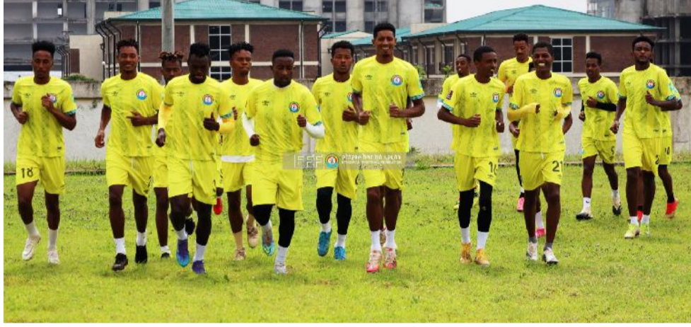
ከ23 ዓመት በታች ብሔራዊ ቡድን ስፖርት በካፍ የልሀቀት አካዳሚ ዝግጅታቸውን አጠናክረው ቀጥለዋል።

አሁን ግን ጨዋታው ቀናት ብቻ የቀሩት በመሆኑ አስልጣኙ ለኢትዮጵያ በፍ አግር ኳስ ተጫዋቾች ቡድኑን እንዲቀላቀሉ በድጋሚ ጥሪ አቅርበዋል። አገራችን