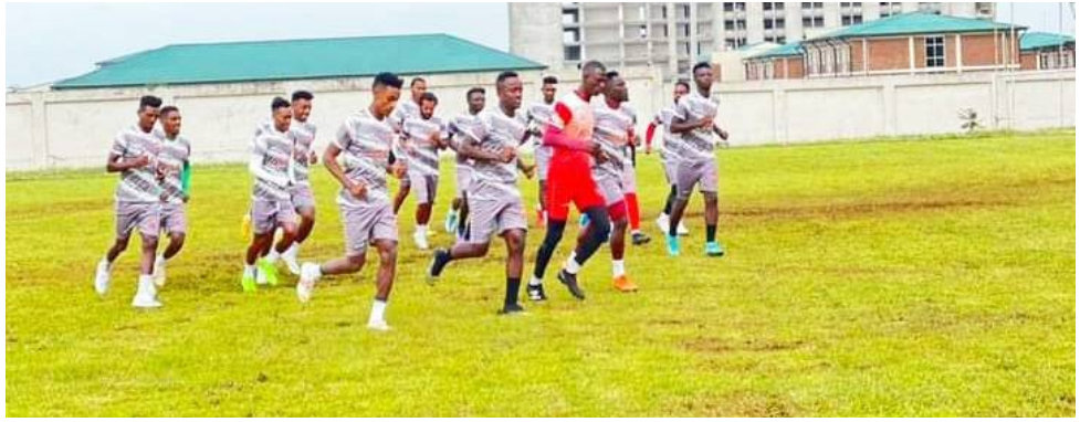
አዲሱ የኮንፌዴሬሽን ጨዋታ በደምር ውጤት ማሸነፍ ከቻሉ በቀጣይ የቱኒዚያውን ሴክሰቲየን የሚገጥሙ ይሆናል።

ካለፉት ጥቂት ዓመታት ወዲህ በኢትዮጵያ ትልቁ የእግር ኳስ ውድድር መድረክ ፕሮግራም ተሳታፊ ከመሆን አልፎ ቻምፒዮንና የዋንጫ ተጨባሪ መሆን የቻለው ፋሲል ከነማ አገሩን ወክሎ በአፍሪካ መድረክ ተሳታፊ ሆኗል። በተለይም አዲሱ የኮንፌዴሬሽን ዋና ጫ የመልስ ጨዋታቸውን በመወከል በተሳተፎ ደረጃ የተሻለ ስኬት አስመዘግበዋል። በነዚህ ሦስት ዓመታት ሁለት ጊዜ የኮንፌዴሬሽን ዋንጫ ላይ አንድ ጊዜ ደግሞ በቻምፒዮንሰለግ መድረክ መቅረብ ችለዋል። ከቻምፒዮንሰለግ ሲገቡ በሆነ በአፍሪካ ቻምፒዮንሰለግ ኢትዮጵያን የወከሉት አዲሱ አምና ሁለተኛ ሆነው በማጠናቀቅ ዘንድ የኮንፌዴሬሽን ዋንጫ ተሳታፊ መሆናቸው ይታወቃል።