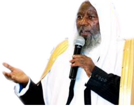
ሺህ ሐጂ ኢብራሕም ቱፋ፤