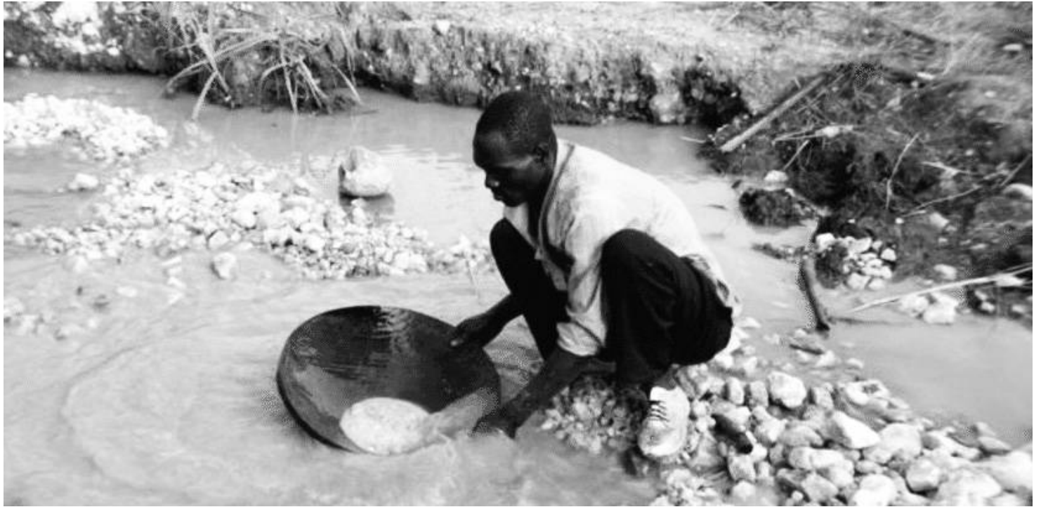
እቅዱ ባህላዊ ወርቅ ስምራችን የወርቅ ማምረቻ ማሻሻያን ለማቅረብ ድጋፍ እንደሚደረግ አመለካከቷል

በበጀት ዓመቱ የክፍለ ኢኮኖሚውን ውጤታማነት ለማጎልበት የሚከተሉት የትኩረት አቅጣጫዎችም በሰነዱ ተመለከተዋል፤ የወጪ ንግድ ማዕድን ሰነድ፣ በመጠንና በብዛት ለገበያ እንዲቀርቡ በማድረግ የውጭ ምንዛሬ ግኝትን ማሳደግ፣ የማዕድን ኢንዱስትሪ ግብአቶችን እና የማዕድን ውጤቶችን በአገር ውስጥ