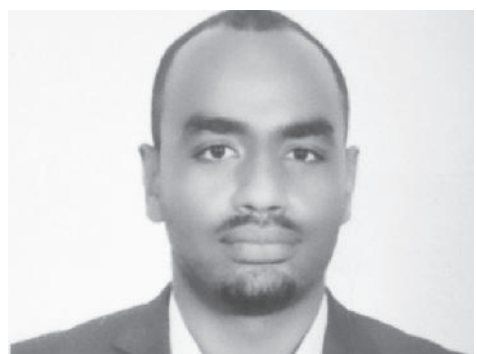
ዶክተር አሳምነው ተሾመ

የመስከረም ወር አየር ሁኔታ ትንበያን ገልጸዋል። መስከረም የከረምት ወቅት መውጫ እንደመሆኑ አሁን ባለው ሁኔታ ከሰሜን ምዕራቅ አማራ አካባቢ፣ አፋር፣ ከምዕራቅ ሀገሪቱ ክፍሎች እየቀነሰ ይሄዳል። ወደ መካከለኛው እና ምዕራብ ሀገሪቱ ክፍሎች ቀስ በቀስ እየጨመረ የሚሄድበት ሁኔታዎች እንደሚኖራቸው ጠቅሰው፤ በምዕራብ አጋማሽ እና ደቡብ ምዕራብ ሀገሪቱ ክፍሎች ጥሩ የዝናብ ስርጭት ይኖራቸዋል።