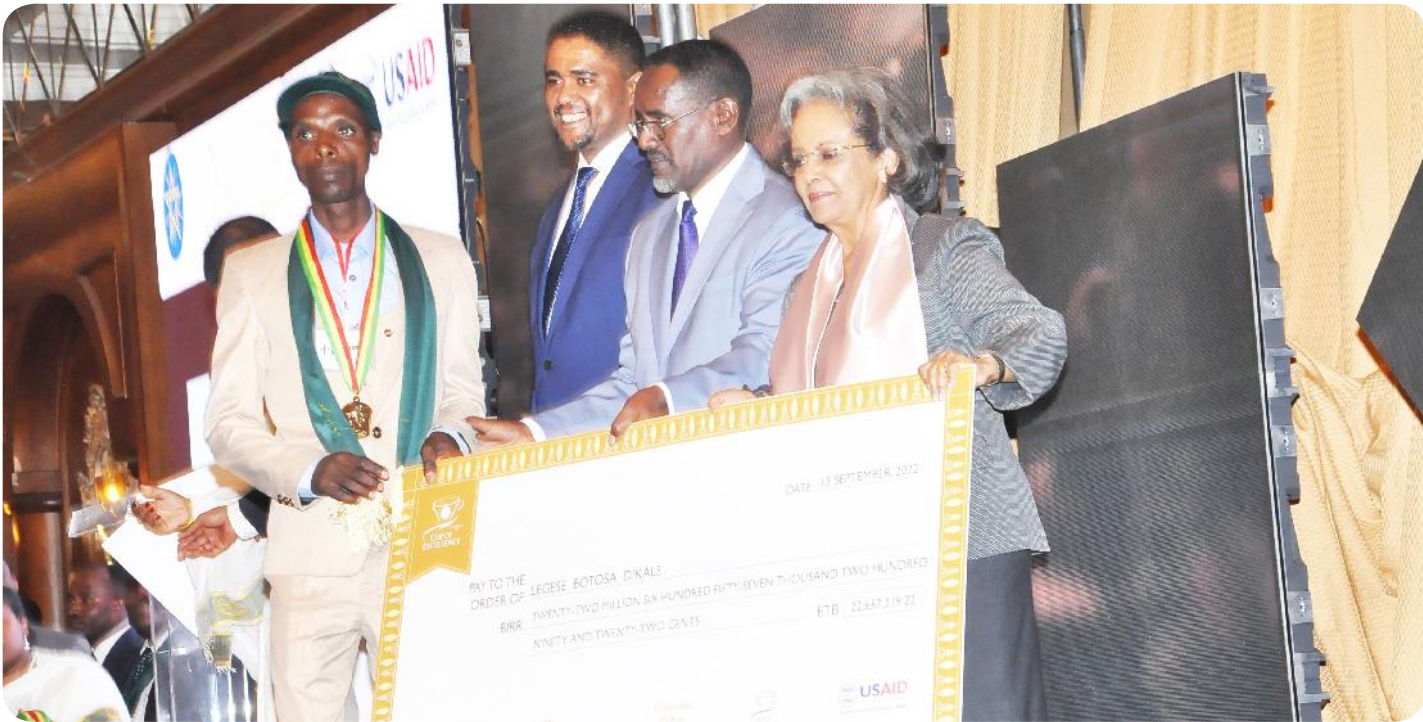
በቡና ልማትና ንግድ ዘርፍ ውጤታማ ሰነድ ባለደርሻ አካላት አውቅና ተሰጥቷል