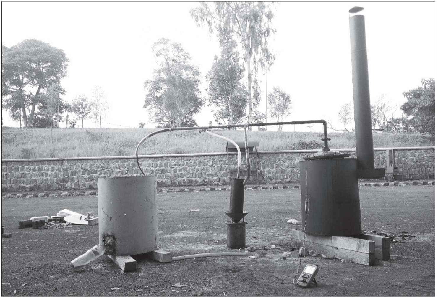
የሥራዎች የፈጠራ ውጤት የሆነው ፕላስቲክን ወደ ነዳጅ መቀየር የሚያስችሎ ቴክኖሎጂ

ስምረት «ርዕስ ጉዳዩን የመረጥነው ከመመረቂያ ጽሑፍነት የዘለለ ትርጉምና ፋይዳ ስላለው ነው። በአሁኑ ወቅት የነዳጅ ፍላጎት መላው ዓለምን የሚመለከት ወሳኝ ጉዳይ እንደሆነ ይታወቃል። በተለይ ደግሞ የአገራችንን ኢኮኖሚና እንደ ግለሰብ እያንዳንዳችንም በደንብ የሚነካ ጉዳይ ሆኗል። ስለሆነም ጉዳዩ ከመመረቂያ ጽሑፍነት የሚያልፍ በመሆኑ ወደ ቢዝነስ ተቋም (Startup Company) በማሳደግ ሥራውን በትልቅ መጠን ለማከናወን እቅድ አለን።» በማለት ታብራራለች። ይህን ለማሳካት ደግሞ ሥራውን በተሻለ መጠንና ጥራት ለማከናወን የሚያስችሉ ጥናቶችንና ዝግጅቶችን ማድረግ እንደሚፈልገው ትናገራለች። የፈጠራ ሥራው