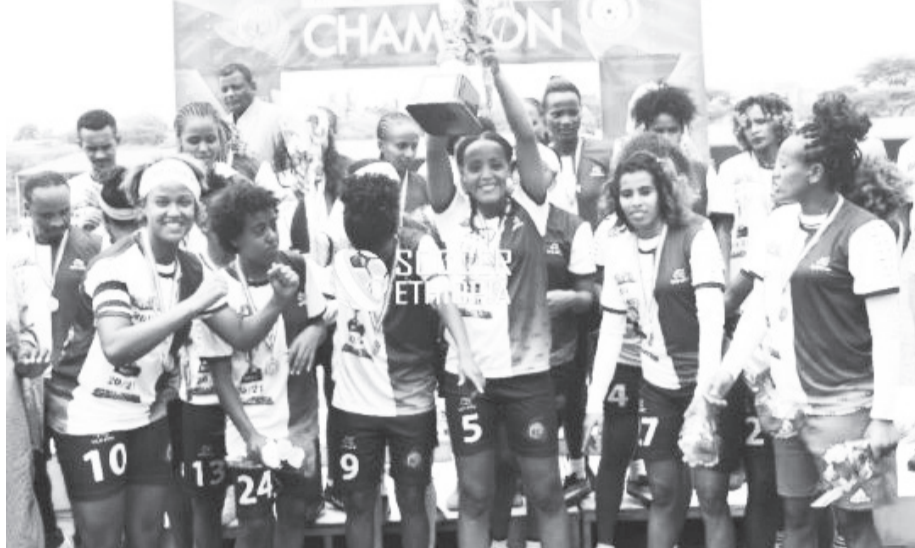
የኢትዮጵያ ንግድ ባንክ ሴቶች ቡድን በስፔርት ውስጥ ያሰጡን ስኬት በሴካፋ ስመሳተፍ ወደ ታንዛኒያ ተዘጋጅቷል።

የኢትዮጵያ ንግድ ባንክ የሴቶች እግር ኳስ ክለብ በምስራቅና መካከለኛው አፍሪካ ክለቦች ቻምፒዮና ላይ የተሻለ ውጤት ለማስመዘገብ ይረዳው ዘንድ ስድስት ተጨማሪ ተጠቃሾችን ከአገር ውስጥ ክለቦች ማስፈረሙ የሚታወስ ነው። ክለቡ ከነሐሴ 7 እስከ 22 ቀን 2014 ዓ.ም በሚካሄደው ቻምፒዮና ላይ ውጤታማ ለመሆን አራዎት አድንገት፣ ኒቦኒ የጎጂ፣ ቅድስት ዘለቀ፣ መሳይ ተመስገን፣ ብርቄ