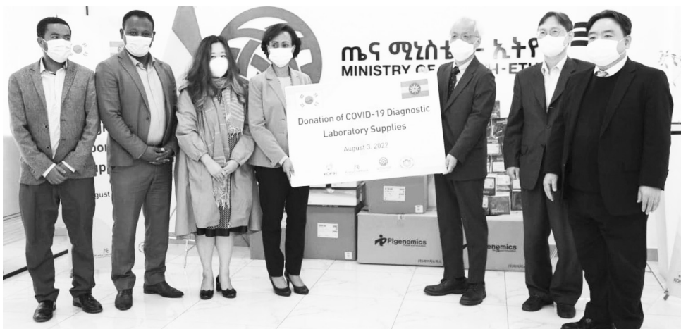
የሚያስችል ነው ብለዋል። በተመሳሳይ፣ የኮሪያ መንግሥትና ኤግዚም

የተደረገው ድጋፍ ከፍተኛውን መሠረት ያደረገ መሆኑን በመግለጽ መሣሪያዎቹ አገልግሎት ሲጀምሩ ለአካባቢው ማግባባት ሰፊ አገልግሎት መስጠት