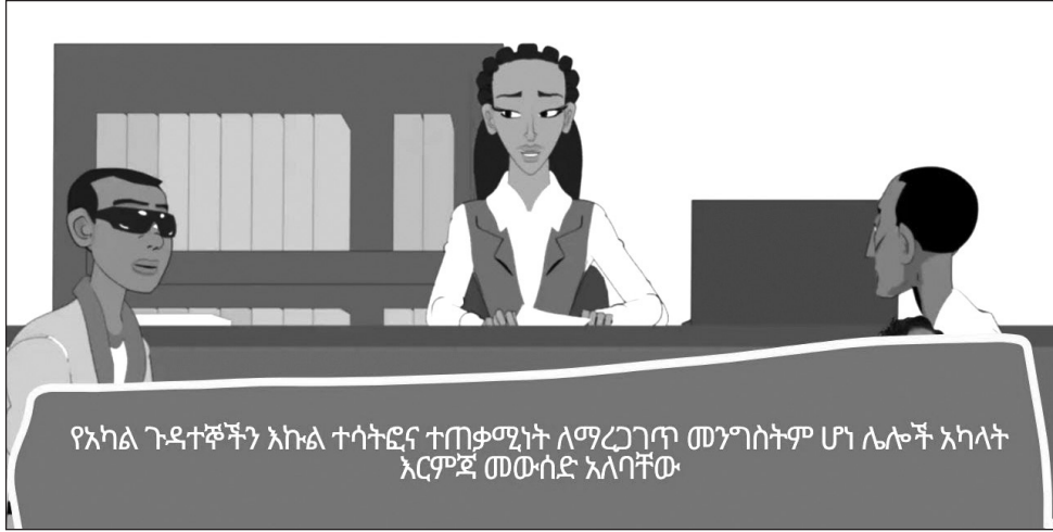
የአካል ጉዳተኞችን እኩል ተሳትፎና ተጠቃሚነት ለማረጋገጥ መንግስትም ሆነ ሌሎች አካላት እርምጃ መውሰድ አለባቸው

በሕገ መንግስቱ አንቀጽ 41 ንዑስ ቁጥር 5 መንግስት አቅም በፈቀደው መጠን ለአገራዊና ለአካል ጉዳተኞች እንክብካቤ ያደርጋል የሚል ሕግ መደንገጉን ወጣት የውብ ዳር ታስታውሳለች። በዚህ ሕገ መንግስት አንቀጽ 90 ንዑስ አንቀጽ 1 ያለ ምንም ዓይነት ልዩነት ሁሉም ኢትዮጵያዊ የአገሪቱ የኢኮኖሚ አቅም በፈቀደው መጠን የትምህርት፣ የጤና እና ሌሎች ማህበራዊ አገልግሎቶች ተጠቃሚ መሆን እንደሚችልም መስፈሩን ትገልጻለች። ሆኖም ትምህርትን በተመለከተ እሷን ጨምሮ በርካታ አንድ እሷ የእንቅስቃሴ ችግር ያለባቸውና ሌሎች አካል ጉዳተኞች ለረጅም ዓመታት የትምህርት ዕድል ከማግኘት ተገልለው እንደቆዩ ታወቀለች። 20 ዓመት እስኪሞላት ድረስ እሷ የትምህርት ዕድል ሳታገኝ መቆየትንም እንደ ማሳያ ትገልጻለች።