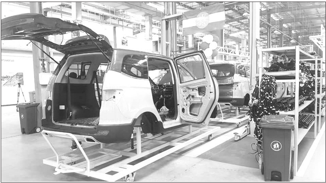
ፋብሪካው አሁን ባለው አቅም በቀን፣ በሦስት ፈረቃዎች 35 ተሽከርካሪዎችን የመገጠም አቅም አለው።

ውስጥ የእሴት ሰንሰለቱ ላይ ብዙ ጭማሪ የሚኖራቸውን በኢትዮጵያ የተመረቱ (Made in Ethiopia) ተሽከርካሪዎችን ለማምረት አቅዶ እየሰራ እንደሚገኝ ነው አቶ በቀለ የሚናገሩት።