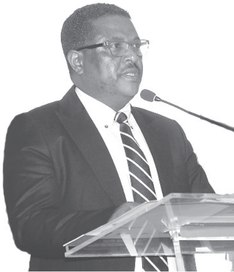
ሱቅ ንጉሱ ጥላሁን