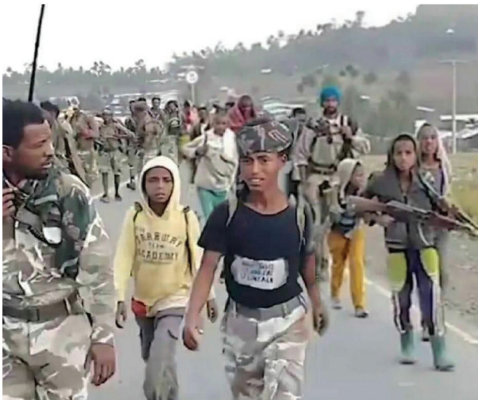
ቡድኑ ... ወደ ገጽ 4 ዞሯል ሕወሓት በርካታ ሕጻናትን ለጦርነት አስጠፋ

ሕጻናትን በጦርነት ማሳተፍ በዓለም ላይ ችግር መሆኑ ታውቆ እኤአ በ1949 በጀኔቫ ስምምነት አንቀጽ 50 ላይ ሕጻናትን ለወታደርነት መመልመል ከልከል ነው ተብሎ ተደንግጓል ያሉት አቶ ቸርነት፤ ይህን ተከትሎ እኤአ በ1977 በወጡ የስምምነቱ ሁለት ፕሮቶኮሎች ከ15 ዓመት በታች የሆኑ ሕጻናትን ለውትድርና መመልመልም ሆነ ለግጭት መጠቀም ወንጀል ነው ተብሎ ተደንግጓል። በተጨማሪ በ1989 የወጣው የሕጻናት ኮንቬንሽን፤ የ1998ቱ የዓለም አቀፍ ፍርድ ቤት ማቋቋሚያ ድንጋጌና የአፍሪካ ቻርተርን ጨምሮ በሌሎችም ዓለም አቀፍ ሕጎች ሕጻናትን ለወታደርነት መመልመል የጦር ወንጀል