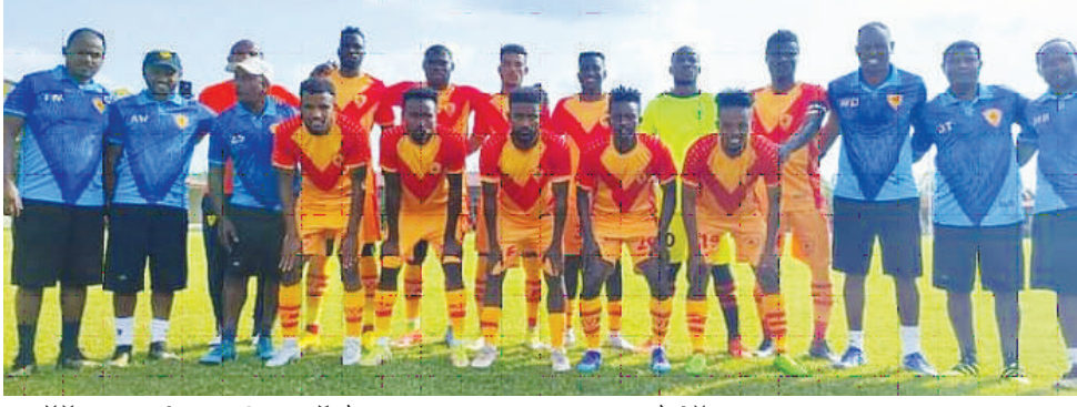
ፈረሰኞች የሱዳንን ኤል ሜሪክ በወዳጅነት ጨዋታ ገጥመው 3-1 በሆነ ውጤት አሸንፈዋል።

የ2014 ዓም የቤትኪንግ ኢትዮጵያ ፕሪሚየርሊግ ፈቃድ ክለብ ቅዱስ ጊዮርጊስ በአፍሪካ ፈቃድ ክለብ ሊግ ውድድር ኢትዮጵያን ወክሎ እንደሚሳተፍ ይታወቃል። ፈረሰኞች በአፍሪካ ፈቃድ ክለብ ሊግ የቅድመ ማጣሪያ ጨዋታዎችን በአዲስ ዘመን መለወጫ እለት መስከረም 1/2015 ዓ.ም ከሱዳን አል-ሂላል ጋር ያደርጋሉ። ለዚህም ከጨዋታው በፊት የተለያዩ የአቋም መፈተሻና የወዳጅነት ጨዋታዎችን ለማድረግ በየዙት እቅድ መሰረት ትናንት ሁለተኛውን የወዳጅነት ጨዋታ ከሱዳን አል ሜሪክ ኤስ.ሲ. ክለብ ጋር በቢሮቶቹ ከቡር ይደነቃቸው ተሰማ አካዳሚ አድርገዋል። ከአረፍት በፊት በተቆጠሩ ሦስት ግቦች ተጋጣሚያቸውን መርታት የቻሉት ፈረሰኞች በጨዋታው አንድ ግብ ብቻ አስተናግደዋል።