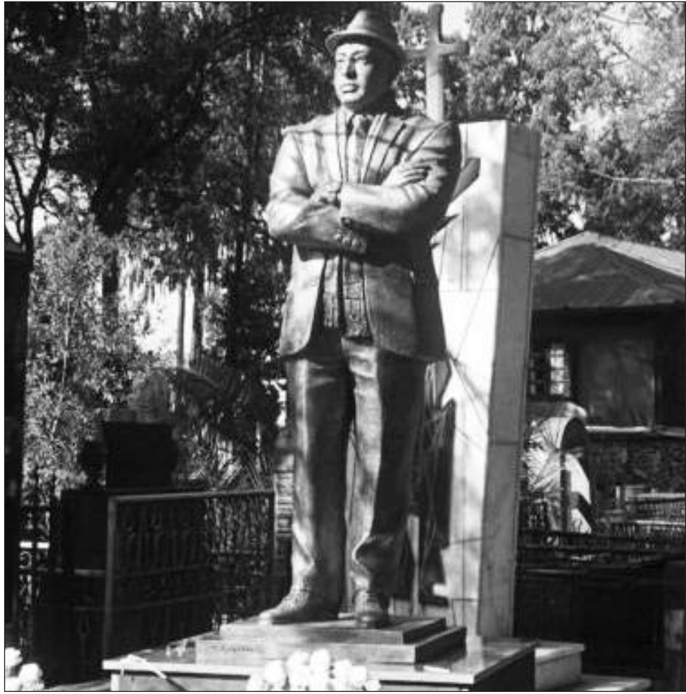
ግንቦት 4 ቀን 2011 ዓ.ም በቅድስት ሥላሴ ካቴድራል በሚገኘው መካነ መቃብሩ ላይ የቅመውና ከፋይበር ግሳስ የተሰጠው የፍቃዱ ተክሰማሪ ያም ሠውልት

አዲስ አበባ አራት ኪሎ አካባቢ ተወልዶ ያደገው፣ በ62 አመቱ ከዚህ ዓለም በሞት የተለየው መሪ ተዋናይ ፍቃዱ ተክሰማሪ መሆኑን ለማሳወቅ በተከታታይ የቴሌቪዥን ድራማዎች (ለምሳሌ "ባለጉዳይ"፣ "የልተከፈለ እዳ"፣ "የአባቶቻችን ስህተት"፣ "ገመና" ...)፣ በፊልሞች እንዲሁም በማህበራዊ ሥራዎቹ እና በፊደሉ ትረካዎችም ጭምር አገር ያውቀዋል።