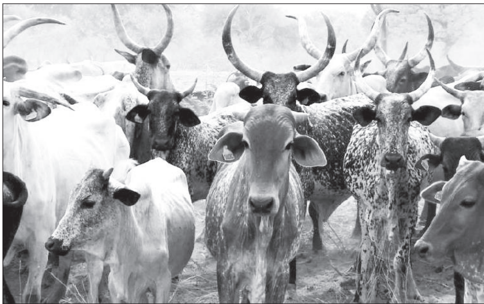
ኢትዮጵያ በእንስሳት ሀብት ከአፍሪካ አንደኛ፣ ከዓለም ደግሞ ተጠቃሽ ከሆኑ ጥቂት አገሮች መካከል ስንዴ ብትሆንም፣ ከሀብቱ የሚገባትን ያህል ተጠቃሚ ስትሆን ስልቻሰችም

የግብርናው ብቻ ተነጥሎ ሲታይ ደግሞ የእንስሳት ሀብት 47 በመቶ የሚሆን ድርሻ አለው። በእንስሳት ሀብት ከሚገኘው ኢኮኖሚያዊ ጠቀሜታ በላይ በአገሪቱ ውስጥ የተመጣጠነ ምግብ ሲታሰብ እንስሳት ቀዳሚውን ስፍራ ይይዛሉ። ከመቀንጨር ነፃ የሚያደርጉ የምግብ ዓይነቶች እንደ ወተት፣ እንቁላል፣ ስጋና ሌሎችም ሲታሰቡ የእንስሳት ጥቅም እጅግ ከፍተኛ ድርሻ ያለውና ከቤተሰብ ሕይወት ጋር ያለው ጥበቅ ቁርኝት ከፍተኛ ነው።