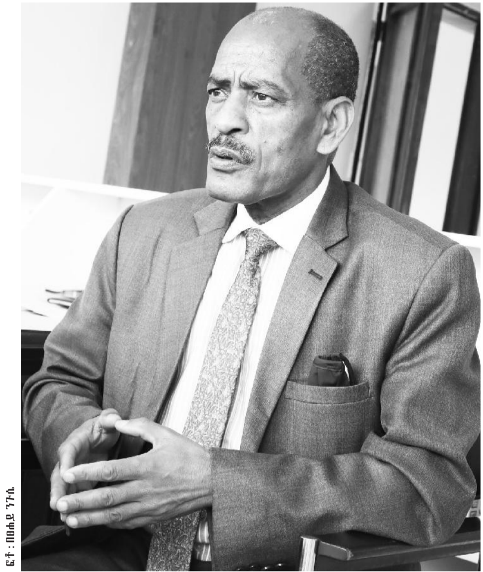
ፎቶ: በጭዳ ገጽታ

ያኔ በቃለ-ጉባኤ አያያዝ ፍጥነትና ጥራት የሚስተካከለኝ አልነበረም። ምሁራኑ የሕገ-መንግሥት፣