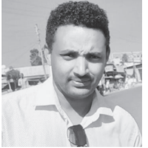
የሃያ ዓመት በታች ውድድር የኢትዮጵያ አትሌቲክስ በዘርፉ የነበረበትን ተተኪ የማፍራት ክፍተት የመሙላት ሂደት እንደነበረውም ነው የገለጸው።

በተከታታይ በተደረጉት ዓለምአቀፍ የሩጫ ውድድሮች በኢትዮጵያ አትሌቲክስ ላይ ከፍተኛ ተስፋ ለማየት ችለው ያለው ጋዜጠኛ ፍቅር፤ በኮሎምቢያው