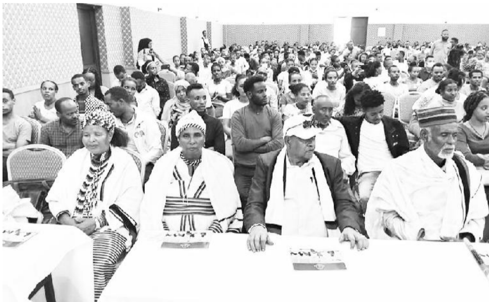
የአሮሚያ ክልል በቅርቡ 729 የሰዎችን ስልጠና

አገሪቱ ተጠቃሚ መሆን የምትችለው በዘርፉ የተሰማሩ ባለሙያዎች ጥሩ አገልግሎት ማቅረብ ሲችሉ ነው ያሉት ወይዘሮ ሰዓዳ፣ ጥራት ያለው አገልግሎት