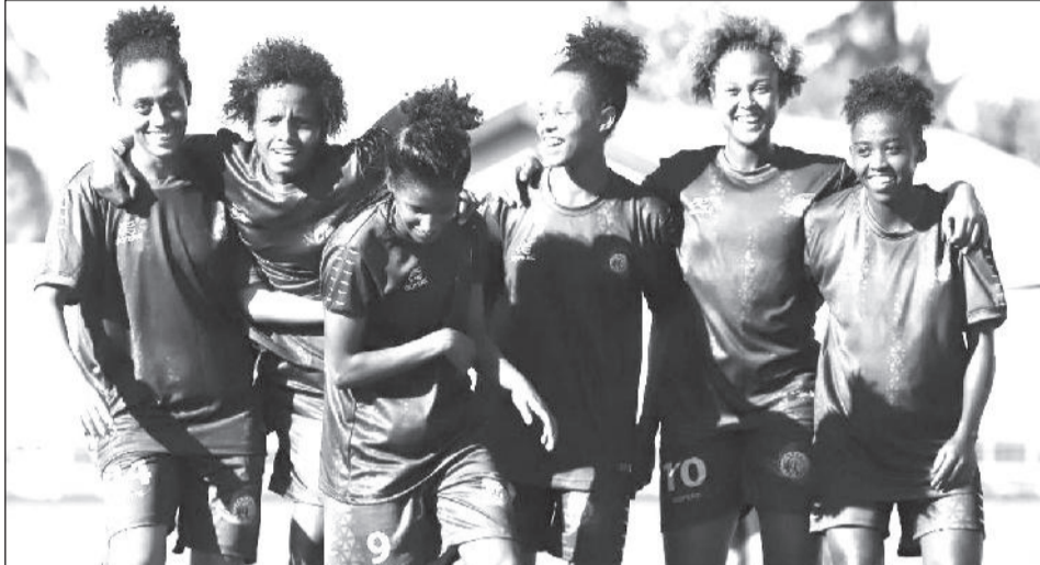
የኢትዮጵያ ንግድ ባንክ ሴቶች ክለብ የዛሬውን ጨዋታ በመርታት ስፍጻሜው እንደሚያልፍ ይጠበቃል።

ካለፈው ዓመት አንስቶ በአፍሪካ እግር ኳስ ኮንፌዴሬሽን (ካፍ) መካሄድ ከጀመሩ ውድድሮች መካከል አንዱ የሆነው የምስራቅና መካከለኛው አፍሪካ (ሴካፋ) የክለቦች ቻምፒዮና ዘንድ ለሁለተኛ ጊዜ በታንዛኒያ እየተካሄደ ይገኛል። አንድ ሳምንት ያስቆጠረው ይህ ውድድር የግማሽ ፍጻሜ ጨዋታዎችን ዛሬ ይስተናግዳል።