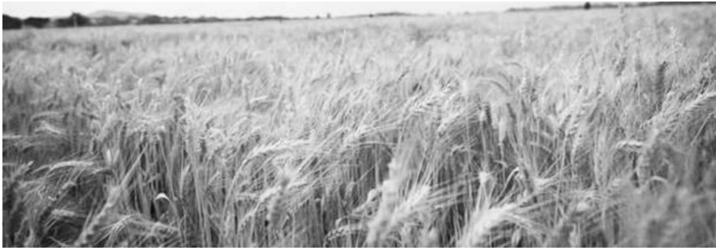
ግብርናው በፋይናንስ አቅርቦት ከተደገፈ ዘመናዊ እርሻን በማስፋፋት ከግብርናው የሚጠበቀውን ምርትና ምርታማነት ማሳካት ይቻላል።

የምጣኔ ሀብት ባለሙያው የሌሎች ሀገሮችን ተሞክሮ በመጥቀስ ሲያብራሩ እንዳሉት፣ ብዙ የአፍሪካ ሀገሮች በቅኝት ግዛት ዘመን ያዳበሩት ሥርዓት አላቸው። ለአብነትም ዚምባብዌ የዶላር ምንዛሪ ዋጋ ሲጨምርና የተለያዩ ችግር ሲያጋጥም የምግብ ጉዳይ ግን ሀገሪቱ ውስጥ እንደገና ተነስቶ አያውቅም። ሀገሪቱ የግብርና ውጤቶችን ለውጭ ገበያ በማቅረብ ገቢ ታገኛለች። ችግሮቻቸው ኖሮው በሀገሪቱ የምግብ አቅርቦት ችግር አለመፈጠሩና በወጪ ንግድ ላይም ተጽዕኖ አለመፈጠሩ የግብርና ሥራው የተስፋፋ በመሆኑ ነው። የግሉ ዘርፍም በሀገሪቱ በስፋት ይንቀሳቀሳል።