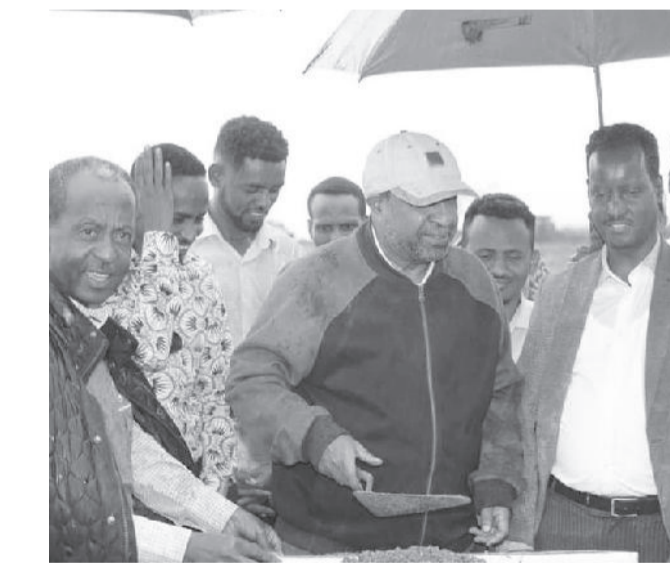
ግንባታውን ለማስጀመር የመሠረት ድንጋይ ሲቀመጥ

ትምህርት ቤቶችን ለመማሪያ ብቻ ሳይሆን ለማሳበረሰብም ሳቢና ማራኪ አድርጎ መገንባት ይጠበቃል ያሉት ፕሮፌሰር ብርሃኑ ፤ በአሸባሪው የወደሙ ትምህርት ቤቶች ደረጃቸውን በጠበቀ መልኩ