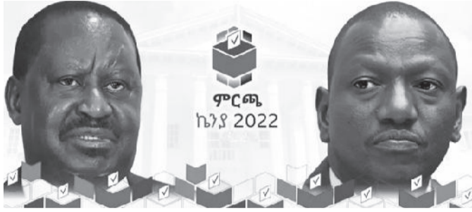
ራይላ ኦዲንጋ እና ዊሊያም ሩቶ ማሳወቅ ይጠበቅባቸዋል።

ወደ 14 ሚሊዮን ድምጽ የሰጡ ሲሆን ይህም ከተመዘገቡት መካከል 65 በመቶ ያህል ነው። የምርጫ ኮሚሽኑ እስከ ማክሰኛ ድረስ ውጤት