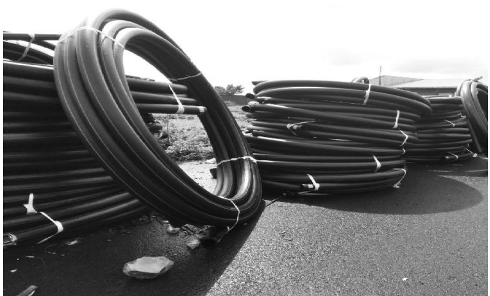
የአማራ ፓይፕ ፋብሪካ የፓይፕ ምርት

የ2014ዓ.ም ፋብሪካው ለአፋር፣ ለጋምቤላ፣ ለአረሚያ፣ ለቤኒሻንጉል ጉሙዝና ሰማሌ ክልሎችና ለአዲስ አበባ አስተዳደር ምርቶችን በጥራት አምርቶ