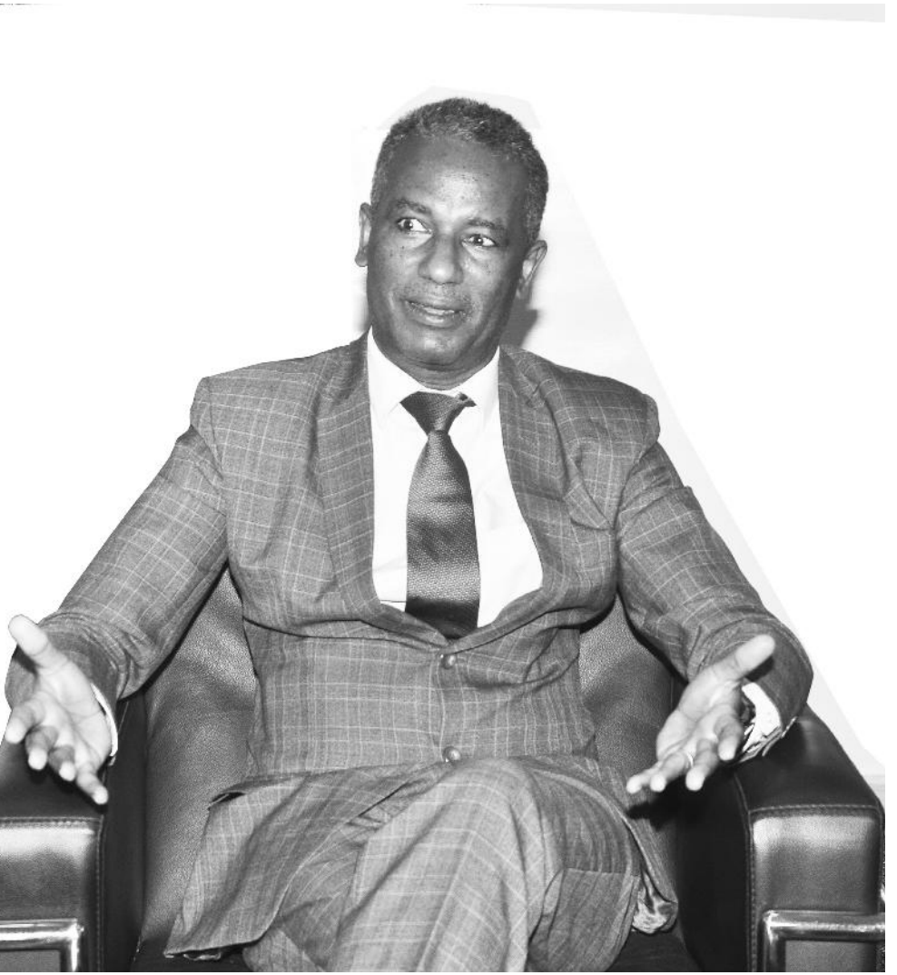
ፎቶ - ሀዲስ አበባ