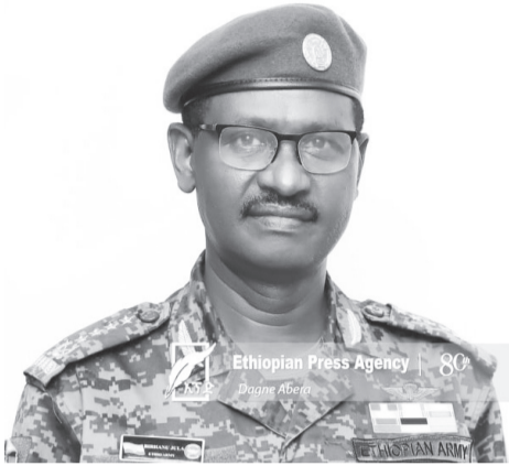
ገልጸዋል። የሎጂስቲክስ አቅርቦት የሰራዊቱ የጀርባ አጥንት መሆኑን የጠቀሱት ፊልድ ማርሻል ብርሃኑ ጁላ።

በ2015 በጀት ዓመት ለሰራዊታችን የተሟላ ሎጂስቲክስ በማቅረብ አስተማማኝ ወታደራዊ ኃይል ለመገንባት እየሠራን ነው ሲሉ ፊልድ ማርሻል ብርሃኑ