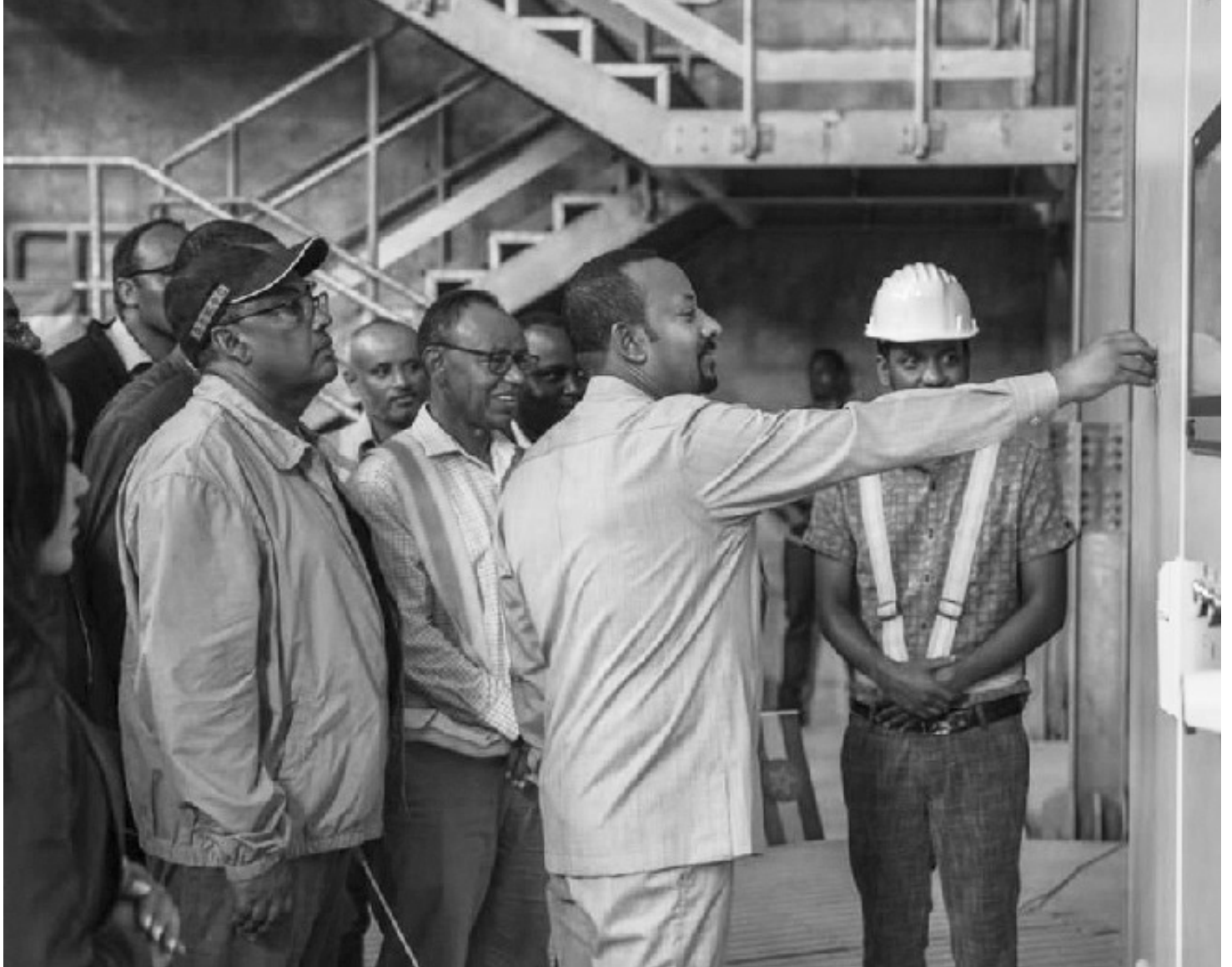
ጠቅላይ ሚኒስትር ዶክተር ዐቢይ ስህመድ ሁለተኛውን ተርባይን ሥራ ባስጀመሩበት ወቅት

በአፍሪካ ደረጃ ብቻ ሳይሆን በዓለም ደረጃ ግዙፍ ከሚባሉ ታላላቅ የሀይድሮ ኤሌክትሪክ ኃይል ማመንጫ