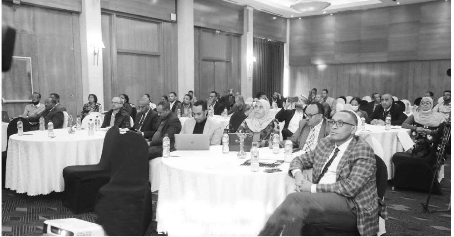
የመድረኩ ታዳሚዎች የመንገድ ዘርፍ የሚመራበትን ግልጽ አቅጣጫና ቀጣይ ግብና ተጨማሪውን በግልጽ ያመለክቱ ሲሉ ፖሊሲውን ገልጸውታል።

ፖሊሲው በዋነኛነት በአገር አቀፍ እና ላይኛ አቀፍ ነገራዊ ሁኔታዎች፣ በኢትዮጵያ መንግሥት የልማት አጀንዳዎች፣ በዓለም አቀፍ ስምምነቶች፣ በዘርፉ አቅም ግንባታ፣ ማዘመንና በተቋማዊ ሽግግር ዓላማዎች ላይ ተመስርቶ