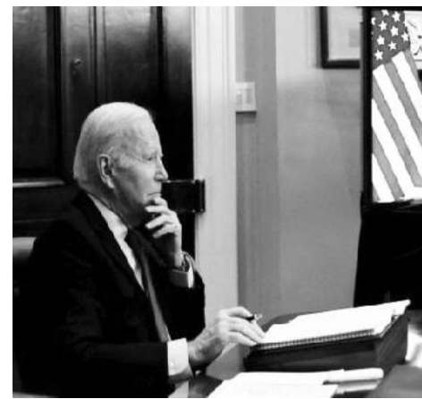
መሳሪያዎችን በሽያጭ መልክ ታቀርባለች። ከትናንት ወዲያ ሐምሌ 21 ቀን 2014 ዓ.ም. ሁለቱ ኃይላን መሪዎች በስልክ በነበራቸው ንግግር ፊት ለፊት ተናግሮ መነጋገር ስለሚቻልበት ሁኔታ መወያየታቸውን የባይደን አስተዳደር ከፍተኛ ኃላፊ ተናግረዋል።

ምንም እንኳ አሜሪካ ታይዋንን እንደ ሉዓላዊት አገር ባትቆጥራትም፤ በዴሞክራሲያዊ መንግሥት የተመረጠው መንግሥት እራሱን መከላከል እንዲችል በሚል የጦር