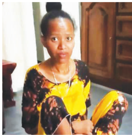
በሠርግ ዋዜማ የመጣው ዱብዕዳ