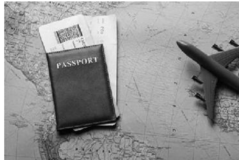
ይህ የሚሆነው ይላሉ የሄንሊይ አጥኝ የሆኑት አመር ዛረጥሊ (ዶ/ር)፤ “ይህ የሚሆነው አገራት ከድሆች ይልቅ ለሃብታም አገራት ድንበርቻቸውን ከፍተኛ ስለሚያደርጉ ነው።” ከፍተኛ የነፍስ ወከፍ ገቢ ካላቸው አገራት የሚመጡ ተጓዦች በመዳረሻቸው በተራዘም፣ በጎሣድ እና በኢንፎርሜሽን ቴክኖሎጂ ላይ ለተቀባይ አገር ምጣሄ ሃብታዊ ዕድገት አዎንታዊ አስተዋጽኦን

የዓለም ባንክ እንደሚለው ከሆነ የአንድ አገርን የፓስፖርት ጥንካሬ ከሚወስኑ ዋና ጉዳዮች መካከል አንዱ ዜጎች የሚያገኙ ፕዝብ መጠን ነው። ከፍተኛ የነፍስ ወከፍ ገቢ ያላቸው አገራት ከረሃ አገራት በተሻለ ወደ በርካታ አገራት ሺዛ ቀድሞ ማግኘት ሳይጠበቅባቸው መጓዝ ይችላሉ።