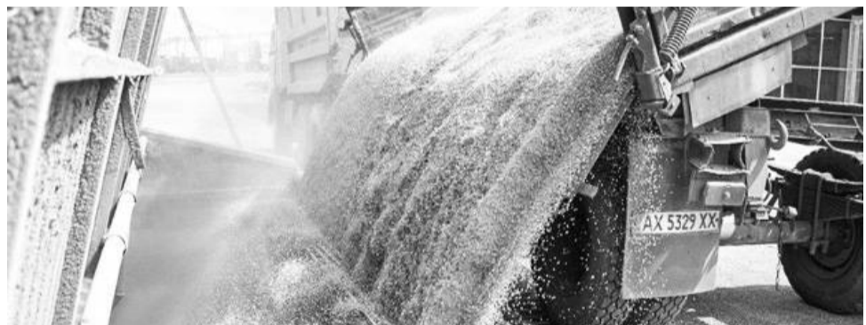
ወደቦችን ዘግታብኛለች በሚል ስትኮንን በአንጻሩ ሩሲያ ውንጀላውን ታስተባብላለች። በአካባቢው ካለው የባሕር ትራንስፖርት መስተጓጎል ጋር በተያያዘም አሁን ላይ ወደ 20 ሚሊዮን ቶን የሚጠጋ የጥራጥሬ ምርት በአዲሱ ሲሎስ ተከማችቶ እንደሚገኝ ቢቢሲ መዘገቡን ኤፍቢሲ ጠቅሷል።

የሩሲያ የዩክሬን ጦርነት ከተጀመረበት ካለፈው የካቲት ወር ጀምሮ የጥራጥሬ ምርት ለዓለም ገበያ እየቀረበ አይደለም። ለዚህ ደግሞ የዩክሬን ሩሲያ የጥቁር ባሕር