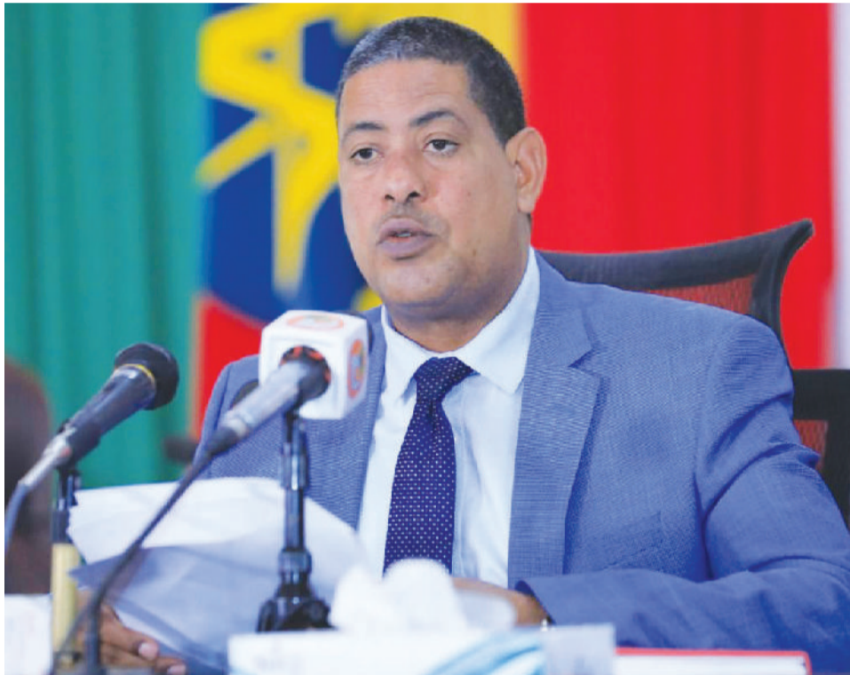
ሕገ ርስቱ ይርዳ