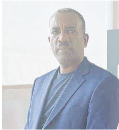
የጉጂ ቡና አጠቃቀም ላይ ሶስተኛው ትውልድ