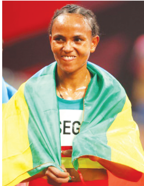
ጉዳፍ ዘጋዩ እና ሰሜቻ ገርማ ሁለት የብር ሜዳሊዎችን በማግኘት ኢትዮጵያን አስቀድሞ