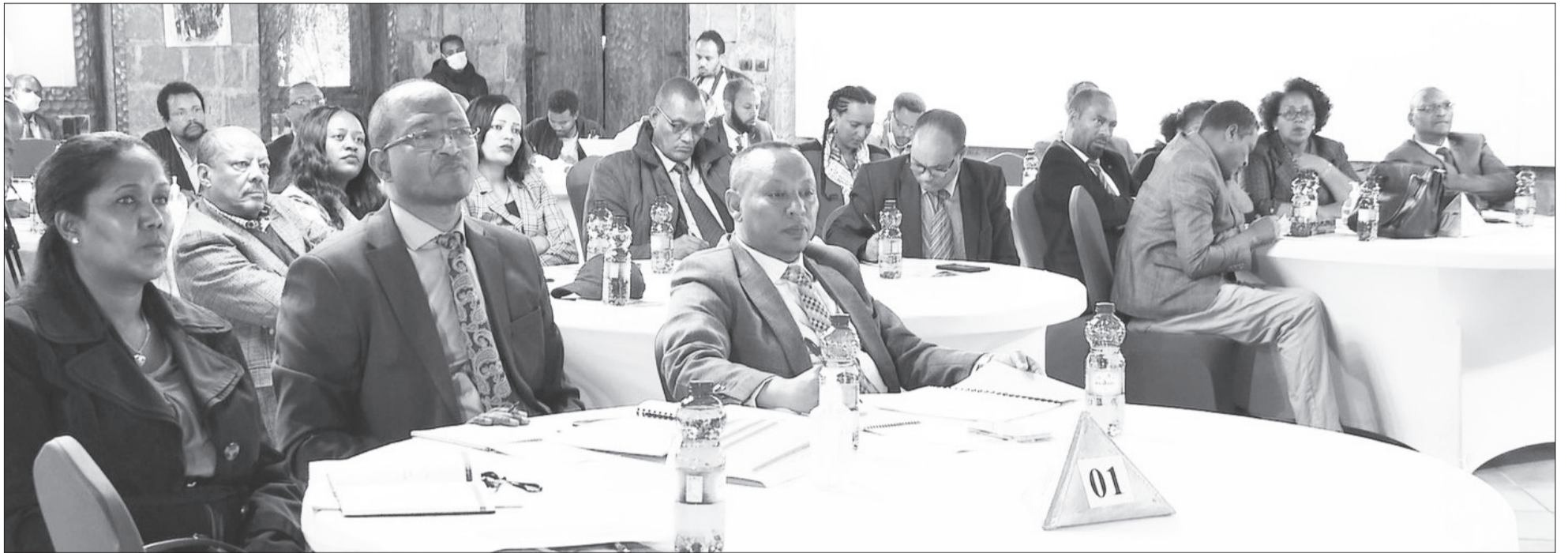
በቢሮቱ ከተማ የተካሄደው የምክር መድረክ