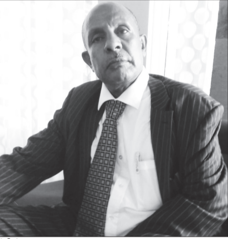
ሸቶ ሸለቆ ሐይቆች

የመጠጥ ውሃ ዋስትናን ለማረጋገጥ የጠራ ውሃ በበቂ መጠን ሊኖረን ይገባል ያሉት አማካሪው፤ በዚህ ረገድ