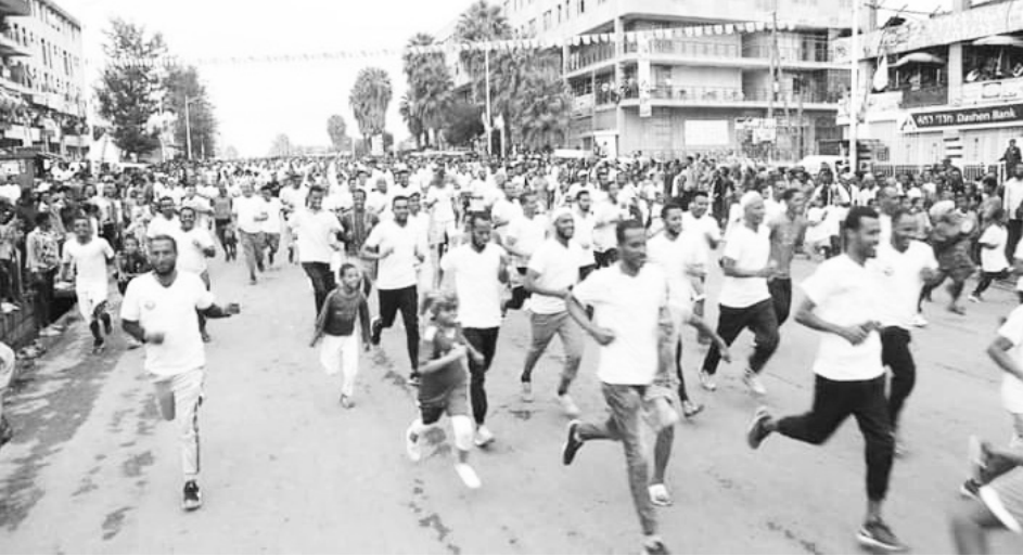
በቡታጅራ ለመጀመሪያ ጊዜ በተካሄደው ውድድር ከ20ሺ በላይ ሰው ተሳትፏል።

ኬር ኦድ የጎዳና ላይ ሩጫ በአለም ላይ ታዋቂ በሆኑ የጉራጊና አካባቢው ኢትዮጵያውያን ተወላጅ አትሌቶች እንዲሁም ታዋቂ በሆኑ የአካባቢው ተወላጅ ሰዎች በጋራ ሆነው የመሰረቱት ውድድር ነው። ከአንድ አመት በፊት በወልቄጤ የ15 ኪሎ ሜትር የጎዳና ላይ ውድድር በማድረግ የጀመረው ኬር ኦድ የጎዳና ላይ ሩጫ ከወር በፊትም በተመሳሳይ ወልቄጤ ላይ ሁለተኛውን ውድድር በማድረግ ለበርካታ አትሌቶች የውድድር እድል መፍጠር ችሏል። ባለፈው አሁኑ ደግሞ በቡታጅራ ከተማ ለመጀመሪያ ጊዜ የ10 ኪሎ ሜትር የተሳካ ውድድር ማድረግ ችሏል። በዚህም ባለፉት ሁለት ውድድሮች የነበሩ ክፍተቶችን በማረም የጥራት ደረጃውንና የሽልማት መጠኑን በማሳደግ ወደ ፊት ትልቅ