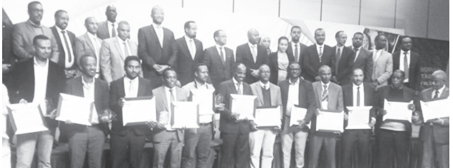
ሚኒስቴር በወጪ ንግድ ከ25 ሚሊዮን ዶላር በላይ ገቢ ሳስገኙ ላኪዎች እውቅና ሰጥቷል

አገሪቷ የተለያዩ ፈተናዎችን ተቋቋሚ በተለይም ለአገሪቷ የውጭ ምንጫ ማስገኘት የሚችለው የወጪ ንግድ ሳይቆራረጥ ማስቀጠልና የተሻለ ውጤት ማስመዘገብ መቻሉ ትልቅ ነገር ሆኖ እንዳገኘች ጠቅሰው፣ መንግሥትም ለዘርፉ ተዋናዮች ዕውቅና መስጠቱ እጅግ የሚያበረታታና ጥሩ ስሜት መፍጠር