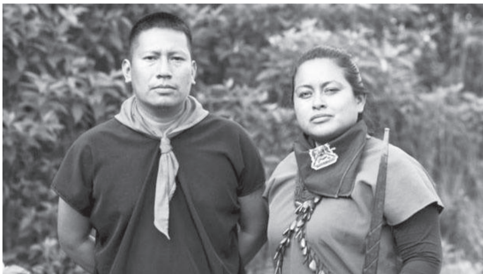
ጉዳዩን በሕግ አልባት ለማግኘት መወሰናቸውንም ይናገራል።