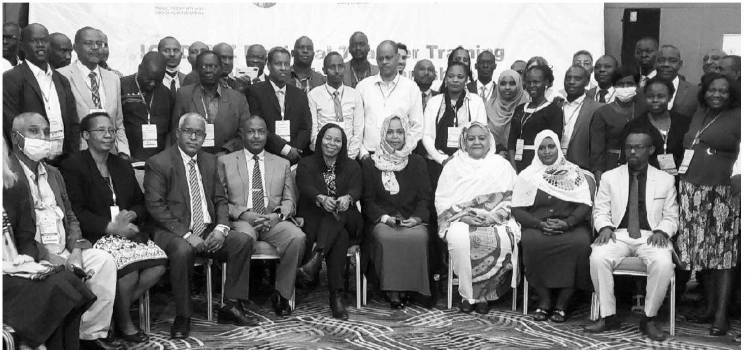
የኢ.ጋድ አባል ሀገራት መምህራን፣ አስተባባሪዎች የልምድ ልውውጥ አድርገዋል።