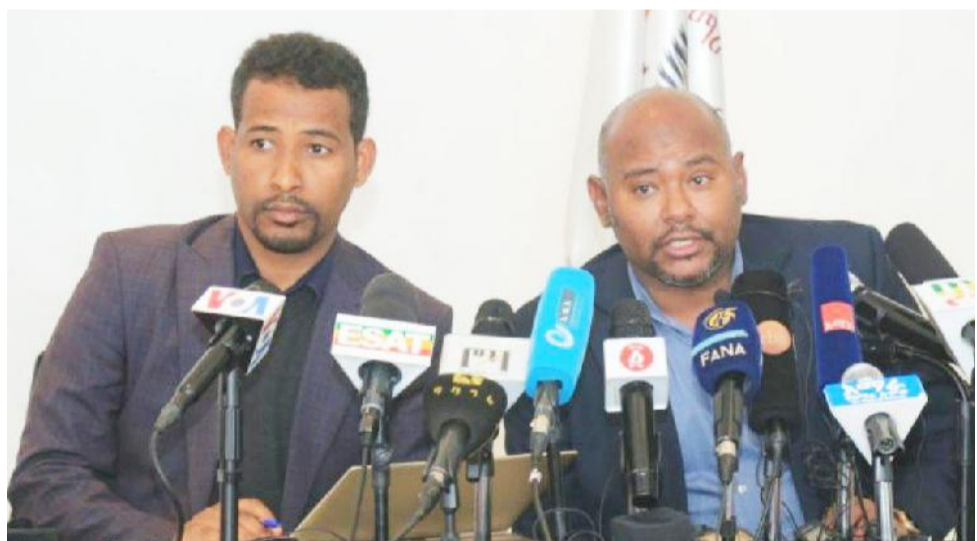
የአብን አመራሮች ጋዜጣዊ መግለጫ