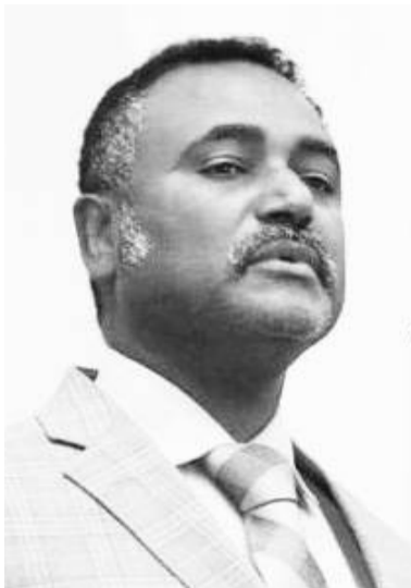
በሙወዝ ጥበባት ዳንኤል ክብረት