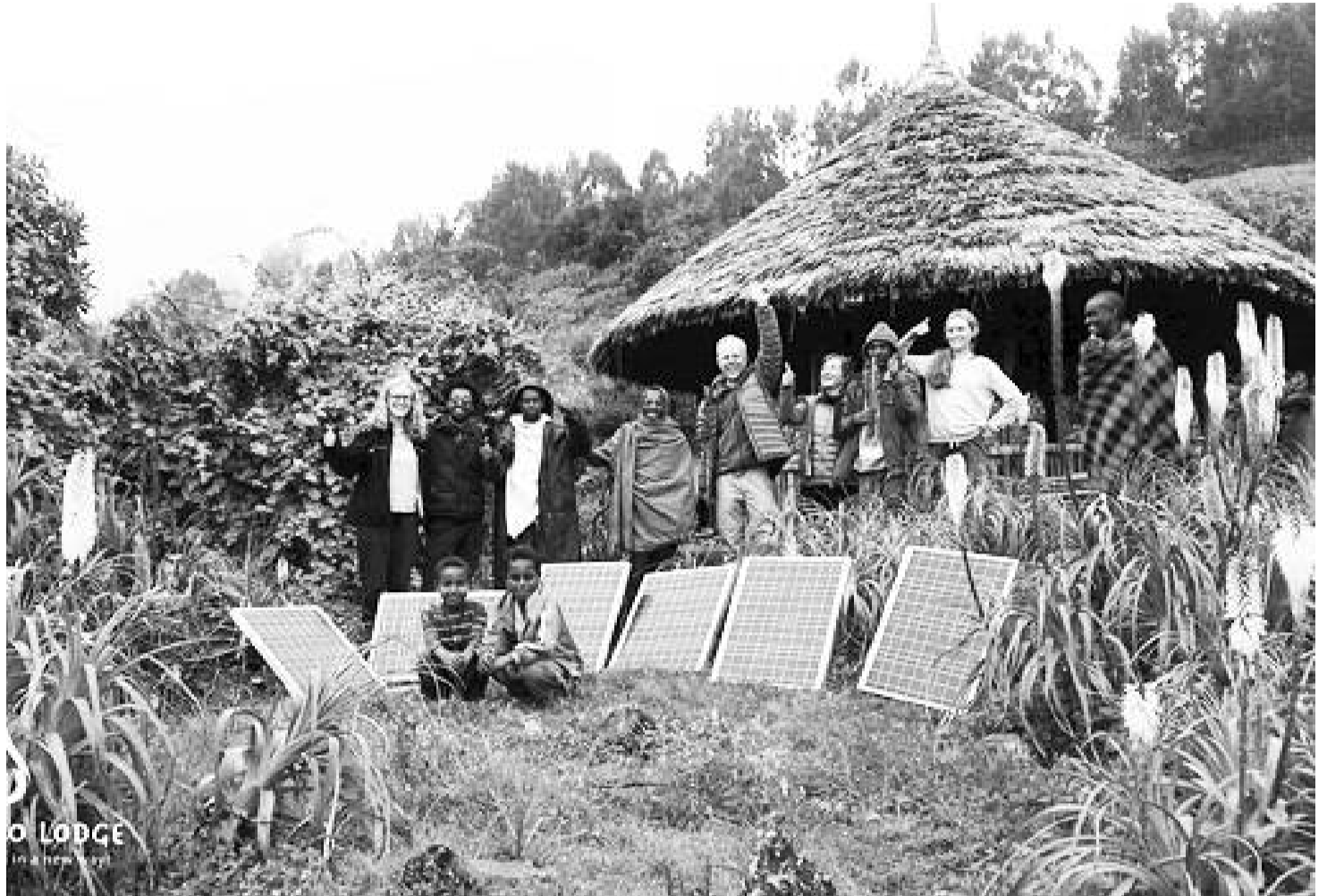
ኢኮኖሚ የቱሪዝም ዘርፉን ብቻ ሳይሆን የቱሪስት መስህቦች ያሉበት ስኬታማ ስራዎችን ለማስፈጸም ከፍተኛ ፋይዳ ይኖራቸዋል።

የዝግጅት ክፍላችን በዛሬው የባህልና ቱሪዝም አምዳችን በግል ጥረት ለቱሪዝም ዘርፉ የበኩሉን አበርክቶ ለማኖር የሚጥር የአንድ ግለሰብ ፕሮጀክትን በመዳሰስ ይህን መሰል ጥረቶች በጥቅሉ ስለሚኖራቸው ፋይዳ ይዳስሳል። አገሪቱን መንግስትና የግሉ ዘርፍ ቅንጅት አስፈላጊነትን በመዳሰስ ለቱሪዝም ዘርፉ ያለውን ፋይዳ አንመለከታለን። ይህ ወጣት በግል ተሳታፊነት በምዕራብ ጎጃም ዞን ደጋ ዳሞት ወረዳ የሚገኘው ማራኪው ሙሉ ኢኮኖሚ መስራችና ከማህበረሰቡ ጋር በቅንጅት የቱሪስት መስህብ እንዲሆን ጉልህ ድርሻ መጫወት የቻለ ነው።