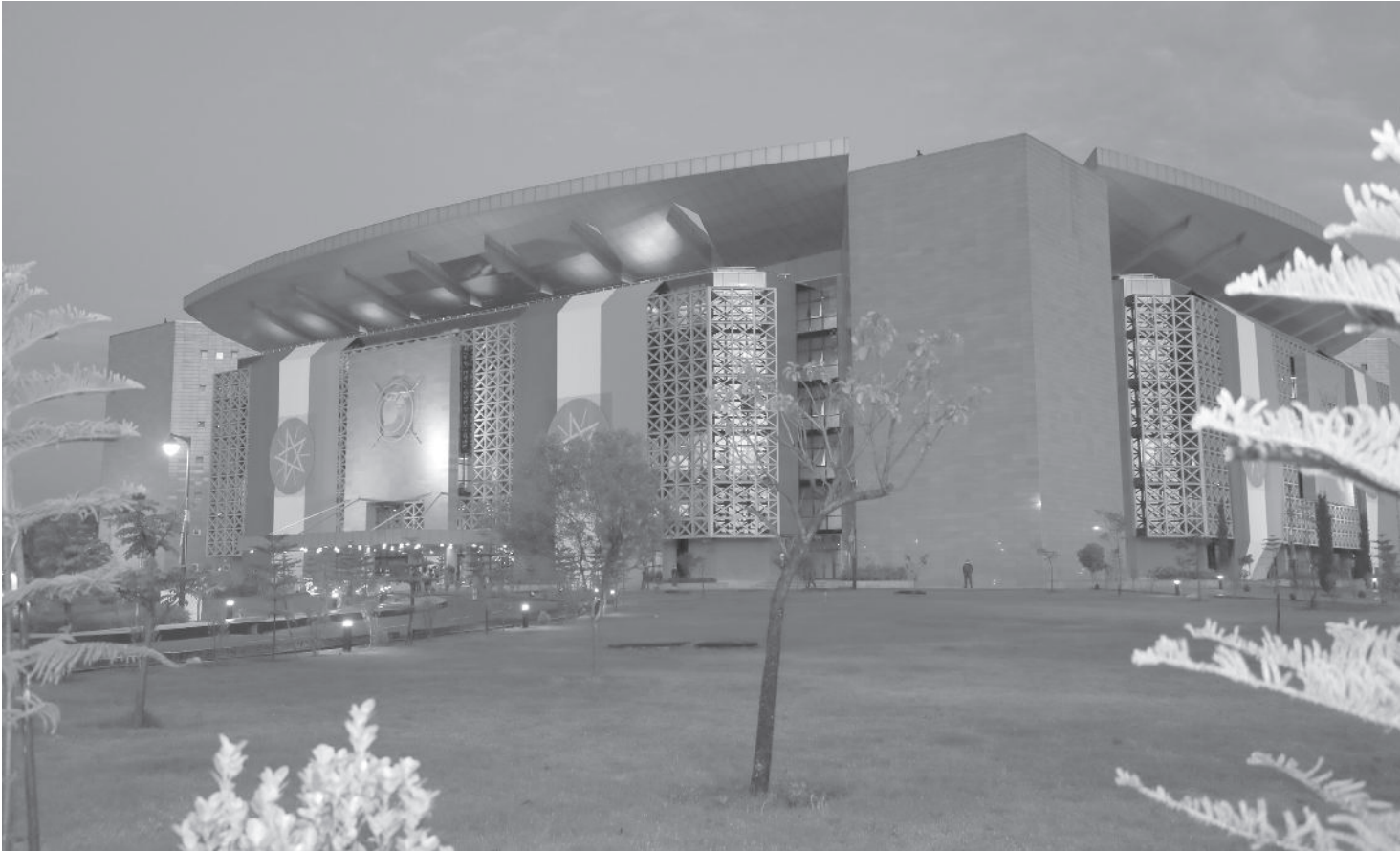
የሀገር መከላከያ ሚኒስቴር ህንጻ

የተቋሙ ቅጽር ጊቢ ውስጥ ተሳስታ የምትገባ ወፍ እንኳን የሚለይ የደህንነት ሥርዓት ተዘርግቷል። የበለጠ አስደናቂው ነገር ግን ዘመቻ የሚመራበት ቴክኖሎጂ ነው። ፍጹም ዘመናዊ ሥርዓት ተዘርግቷል። ጦሩ በአሸባሪው ሕወሓት ወረራ ከገጠመው አደጋ አሁን ሙሉ ለሙሉ አግግሟል። በሰው ሃይልም በትጥቅም ተደራጅቷል። የቴክኖሎጂ ድጋፍ አግኝቷል። ልክ እንደ አየር ሃይሉ ሁሉ የምድር ጦሩም ከፖለቲካ እንደተነጠለ መሪዎቹ በሙሉ እምነት ይናገራሉ።