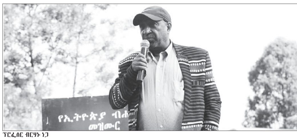
ፕሮፌሰር ብርሃኑ ነጋ

የትምህርት ሚኒስቴር የትምህርትን ጥራትን ለማሻሻል በአጠቃላይና ከፍተኛ ትምህርት ልማት ዘርፎች ሌሎችንም የተለያዩ እርምጃዎች በመውሰድ ላይ መሆኑንም ፕሮፌሰር ብርሃኑ ጠቁመዋል ሲል የዘገበው አፍሪቃ ነው።