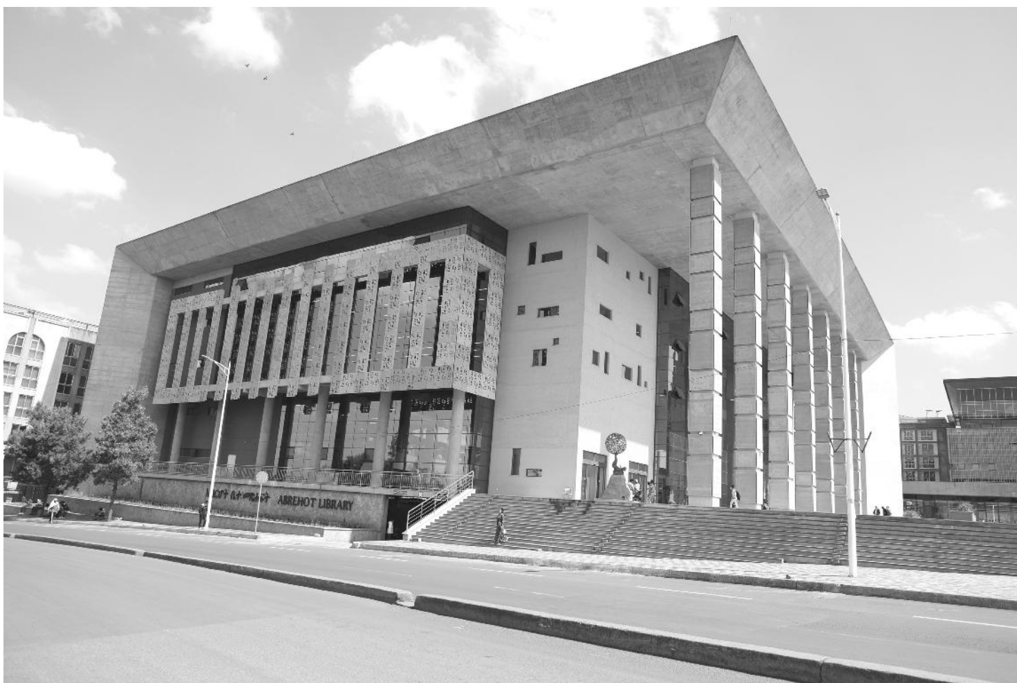
የአብርሃት ቤተ መጻሕፍት ከፊል ገጽታ

ለምሳሌ ያህል አራቱ ቤተ መጻሕፍትን ብንመለከት ፋይዳቸው እና ትርጉማቸው በጣም ከፍ ያለ ሆኖ አግኝተናል። የአብርሃት ቤተ መጻሕፍት ፤ የሳይንስ ሙዚየም ፤ የአጽዋት ማእከል እና የማእድን ጋለሪ እያንዳንዳቸው ራሳቸውን ችለው መቆም የሚችሉ ጽንሰ ሃሳቦች እና ተቋማት ናቸው። እነዚህ ተቋማት ስለ ነገይቱ