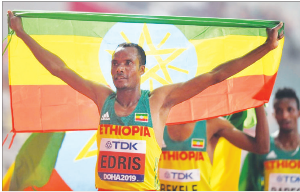
ስቦስተኛ ስቦስተኛ የዓለም አትሌቲክስ ቻምፒዮና በ5ሺ ሜትር የወርቅ ሜዳልያ እንደሚያጠቃ ይጠበቃል።

የእንግሊዘውያን መመኪያ የሆነው ሞ ፋሪህ በወቅቱ መቀደሙን ለማመን የተቸገረ ከመሆኑም ባለፈ የውድድር ሕይወቱም ላይ ለውጥ ያስከተለ ሽንፈት ነበር በሙከታ