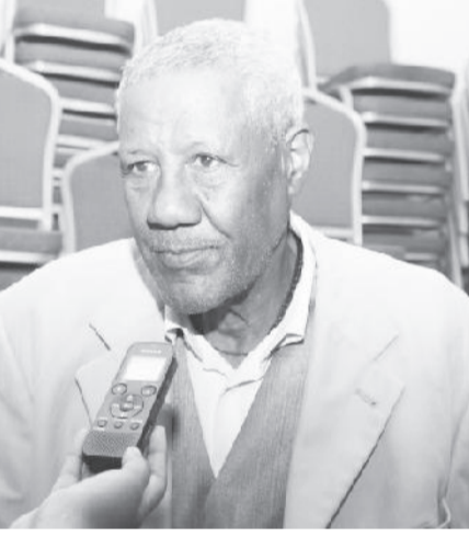
መቼ ስስቃ ተክሎ ወልደ