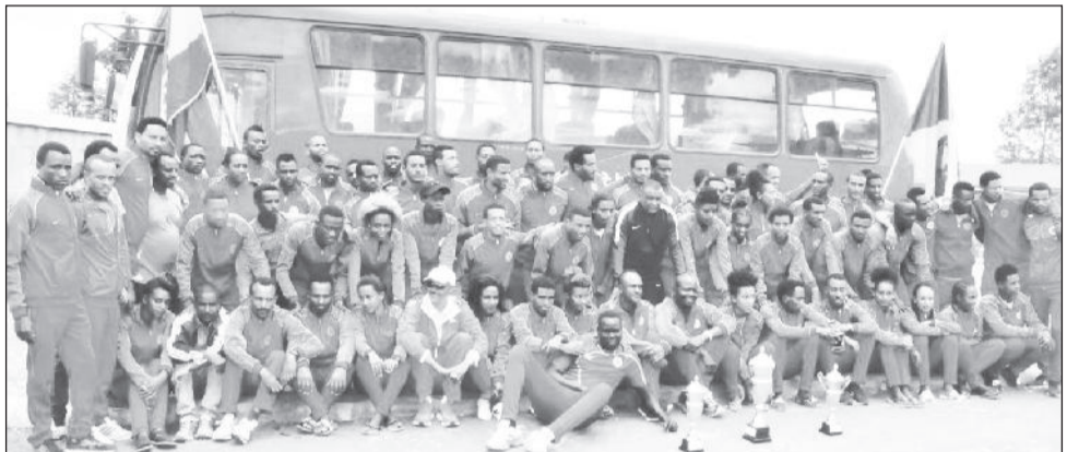
መከላከያ ስፖርት ክለብ ዓመታትን ባስቆጠረ ጉዞው በተለያዩ ዓለም አቀፍ መድረኮች ስፖርት ይኮረ ስፖርተኞችን በማፍራት ቀዳሚ ነው።

የመቻል ስፖርት ክለብ ተብሎ ሊጠራ እንደተዘጋጀ ሁሉ ምድር ጦርም ተብሎ ይጠራ የነበረ ሲሆን፣ ክለቡ በእግር ኳስ በተለይም ደግሞ ከ1970ዎቹ አጋማሽ እንስቶ በነበረው ገናና ውጤታማነት ከደጋፊዎቹ ይሰጠው የነበረው ድጋፍ እና ማበረታታትም ታሪክ የማይረሳው እንደሆነ ይታወቃል።