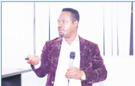
ሸቶ ጌታቸው ግርማ፣