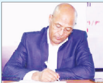
ሸቶ ዘገየ በላይነህ፣

ለአንድ ሀገር ልማትና እድገት ከዜጎች የሚሰበሰበው ግብር በተለያዩ የሀገሪቱ የልማት ዘርፎች ላይ ስለሚውል ፋይዳው የጎላ ነው። ግብር መክፈል የዜግነት ትልቁ ግዴታ ነው። ከዜጎች የሚሰበሰበው ግብር ነው ተመልሶ ለመንግሥት ተቋማት፣ ለሠራተኛው ደመወዝ፣ ለጤና፣ ለትምህርት፣ ለግብርናው ዘርፍ፣ ለሀገር መከላከያና ለፖሊስ፣ ለሀገሪቱ ጸጥታና ደህንነት ጥበቃ ወዘተ የሚውለው። ግብር የሀገር ሕይወት፣ አቅምና ጉልበት ነው። ዜጎች ወቅቱን ጠብቀው ግብር ካልከፈሉ ሀገራዊ ሥራዎችን የመሥራት አቅም እንዲሁም የእድገትና የልማት ሕልጦችን ትልሞችን የማሳካት አቅም አይኖረንም። ግብር አንድ መንግሥት እንደ መንግሥት ትልቁን ሥራውን ለመከወን የሚያስችለው የፋይናንስ አቅም የሚያገኝበት የሀገር ውስጥ ገቢ ነው። ታዲያ በርካታ ሀገራዊ የልማት ሥራዎች የሚከናወኑት፣ በጀት የሚወጣላቸው፣ በእቅዱም መሠረት ወደ ሥራ የሚገባው ከሕዝቡ በሚሰበሰበው ግብር ነው። ከውጭ ለተለያዩ የልማት ሥራዎች ከሚገኘው ብድርና እርዳታ ውጪ የየትኛውም ሀገር መንግሥት ዋነኛ የገቢ ምንጩ በሀገር ውስጥ የሚሰበሰበው ግብር ነው። ስለዚህ ዜጎች በግብር በኩል ያለባቸውን ሀገራዊ ኃላፊነት በውል ተገንዝበው በወቅቱ ሲከፍሉ ለሀገራቸው ልማትና እድገት የበኩላቸውን ከፍተኛ ድርሻ እንደተወጡ በማመን ሊኮሩበት ይገባል። በመሆኑም ግብር መክፈል የዜግነት ግዴታም፣ ከብርም ነው። ሆኖም ሀገራዊ የግብር አሰባሰብ ሥርዓቱ ለዘመናት ኃላፊ በሆነ መንገድ ሲከናወን ሳይዘገም ቆይቷል። ታዲያ በተለይ በሀገሪቱ ከመጣው ለውጥ በኋላ የአገሪቱን የግብር ሥርዓት በዘመናዊ ቴክኖሎጂ ከማዘመን ባለፈ በመንግሥት በኩል ከመቀየር ጥናት ጀምሮ የአደረጃጀት ለውጥ በማድረግ ግብር ከፋዩ ሕዝብ በተለይም ነጋዴው በሁሉም አይነት የመሳሰሉት