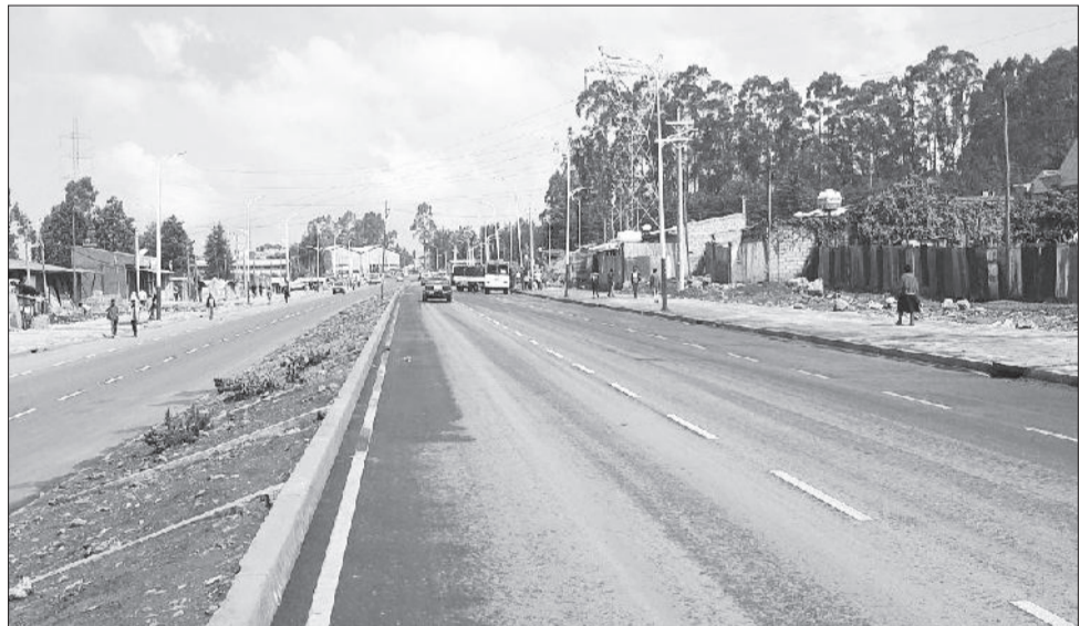
ለአስፓልት ክፍት የተደረገው ሳንሱሲ - ታጠቅ- ኬሳ አስፓልት ኮንክሪት መንገድ

ሥራ ላይ የተሰማሩት አቶ ደመቀ ለገሠ እንደገለፁት፤ መንገዱ ከመሰራቱ በፊት ጠባብና ለማሸከር አስቸጋሪ እንደነበር ጠቁመው፣ መስመሩ መውጫና መግቢያ በር ከመሆኑ የተነሳ አውቶበስና ተሳቢ መኪና ተጋጭቶ ከአስር ሰው በላይ ሕይወት ያለፈበት አጋጣሚ እንደነበር ጠቁመዋል።