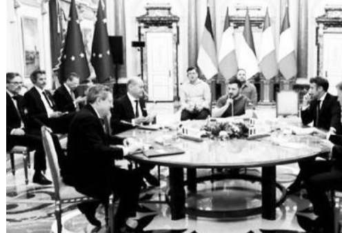
የአውሮፓ አገራት መሪዎች ከክሬን ፕሬዚዳንት ጋር

በተጨማሪም የክሬን ራሷን እንድትከላከልና በሞስኮ የተያዙባትን ቦታዎች ለማስመለስ በአስገኝቷ ተጨማሪ