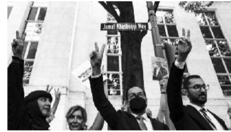
ጀማል ካሾግጂ መንገድ

ጋር አያይዘውታል። ልዑሉ ግን በግድያው ውስጥ እጃቸው እንደሌለበት አስተባብለዋል። የሳውዲ ዐቃቤ ሕጎች ጉዳዮቹ “ሕገ ወጥ” ወኪሎች ናቸው ሲሉ ይከሳሉ።