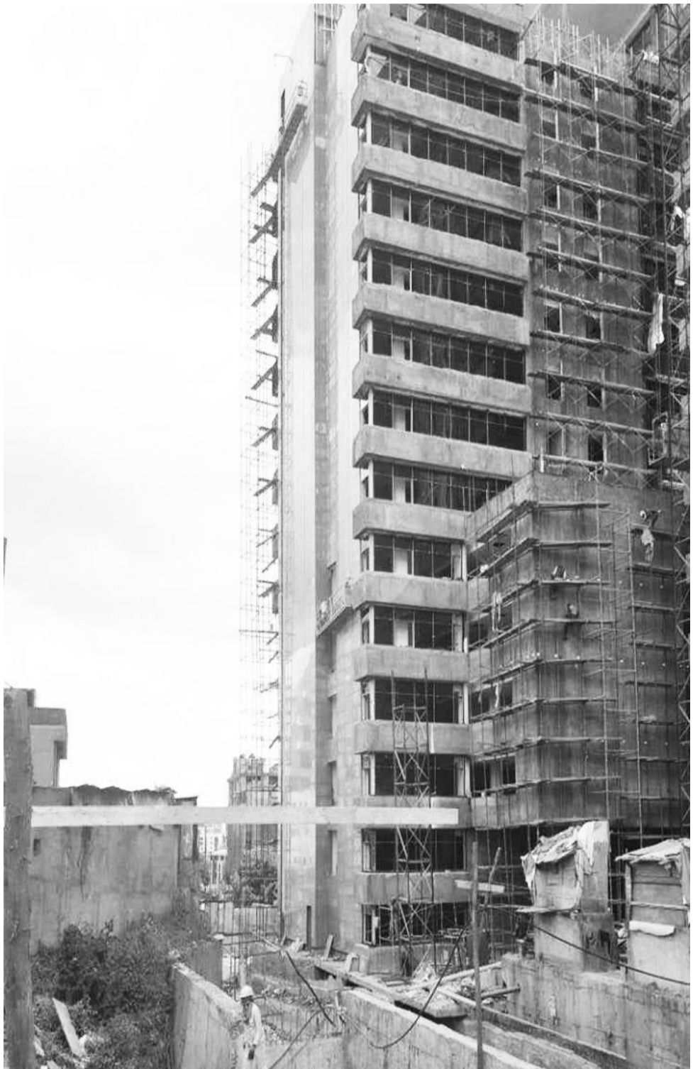
አየተገነቡ ካሱ የፌዴራል መንግሥት ስንጻዎች አንዱ፤

በዚህ ዘርፍ የተሰማሩ ተዋናዮች ተጠቃሚው ዜጋ፣ አሠሪዎችና ባለሙያዎች ለዘርፉ ዕድገት የሚኖራቸው