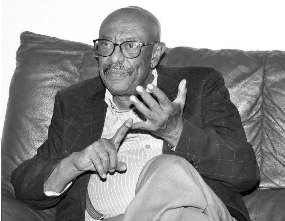
ከሁለት ሺ ስዎች በላይ በሰራቸው ቀጥረው ያሰሩ ነበር።

ደክተር ጌታቸው፡- እኚህ ነጋዴ ከስማቸው ጀምሮ አስገራሚ ታሪክ ያላቸው ሰው ነበሩ። የሚገርም ስኬት እኚህ ሰው ጎንደራ ናቸው፤ የአባታቸው ስም ጌታቸው ነበር፤ ከጎንደር ወደ አስመራ እየሄዱ እህል፤ ከአስመራ ደግሞ ጨው እያመጡ ይሸጡ ነበር። እኚህ ነጋዴ እንደልባቸው እንዲገቡ እንዲወጡ ጌታቸው የሚለውን የአባታቸውን ስም በመተው ወደ ጎይቶም ቀይረውታል። አንድ ቀን ማርዮ የሚባል ጣሊያኖዊ ከአስመራ ምፅዋ ይወስዳቸዋል፤ «ሲጋራ ግዛ» ብሎ 10ሺ ሊሬ ይሰጣቸዋል። በወቅቱ የ17 ዓመት ጎረማ ሲሆን የነበሩት እኚህ ሰው በተባሉት መሰረት ሲጋራውን ገዝተው ሲመለሱ ውሃ ላይ የሚጎሳፈፍ ቤት ያያሉ፤ ያለመሰረት ውሃ ላይ በሚኖሩት ቤት መሳይ ነገር ተደንቀው ጠጋ አሉት፤ ስዎች ወደ ውስጥ ሲገቡ አይተውም ተከትለው ገቡ። አንድ ገቢ መርከብኛ ያገኛቸው ለነጭ ብቻ የተፈቀደ ነው ምን ትሰራለህ? ብሎ ያፈጥባቸዋል፤ ማርዮ የተባለ ሰው ሲጋራ ግዛ ብሎ ልኳቸው እንደሆነና መውጫው እንደጠፋባቸው ይናገሩታል። ያ ሁሉ ሲሆን ታዲያ አንድ ሰዓት ተኩል ያህል ጊዜ በመርከብ ተገዘው እንደነበር አላወቁም ነበር። በዚያው ተልከው ወጡ ሚላኖ አረፉ፤ በመቀጠልም ቡዳ ፔስት፤ አስትሪያ እየተዘዋሩ ሰርተዋል።