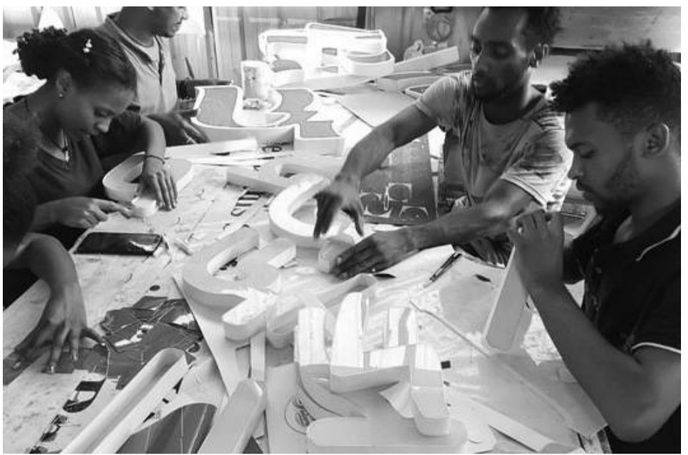
ድርጅቱ ለ 52 ሠራተኞች የሥራ ዕድል ከፍቷል

የማስታወቂያ ሥራዎች አዲስ አበባ ከተማን ጨምሮ በክልል ከተሞች ሳይቀር የከተሞችን ገጽታ በማሰፋት እንዲሁም በማቆሻሻ ስማቸው በአጅጉ ይነሳል። ማስታወቂያዎቹ ወቅት ሲያልፍባቸው የሚያስወግዳቸው ካለመኖሩና በሥርዓት የሚመሩ ካለመሆናቸው ጋር ተያይዞ ከትንሹ ማስታወቂያ አንስቶ እስከ ትላልቆቹ ቢልበርዶች ድረስ የከተሞች ትግሮች መሆናቸው አይካድም። ይህ ሁሉ ትግር የሚያመለክተው ማስታወቂያውን የሚመራ አካል በሚገባ ኃላፊነቱን አለመወጣቱን ብቻ አይደለም፤ የማስታወቂያ ስራ እየዘመነ አለመሄዱም ጭምር ነው።