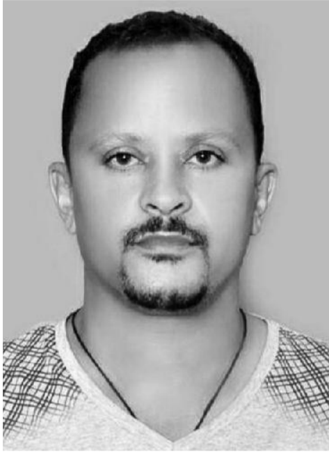
ስቶ ደረጃ እያሱ