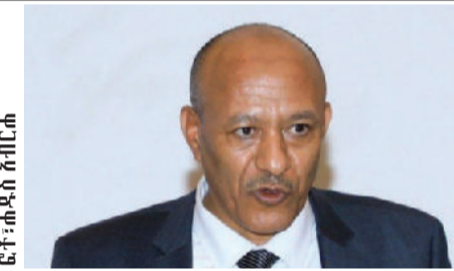
ፎቶ: ጠቅላይ ገንቢ