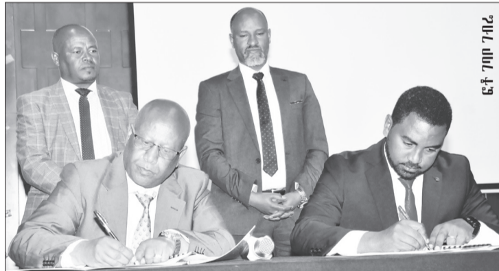
ከደብረ-በርሃን ትምህርት ጉዳይ ጋር