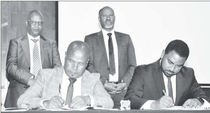
ከሕጻን ትምህርት ጉዳይ ጋር