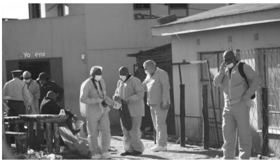
“ይህ አሰቃቂ ሁኔታ የአገራችንን ወጣቶች አጠቃላይ በምናደርግበት የወጣቶች ወር ላይ መከሰቱ በእጅጉ ያሳዘነናል” ሲሉ ፕሬዚዳንቱ በትዊተር ገጻቸው ላይ

ከ22 የሚበልጡት ወጣቶች አስከሬንም ምናልባት ተመርዘው እንደሆነ ለማወቅ እንዲሁም ተጨማሪ ምርመራ ለማድረግ ወደተለያዩ የሕክምና ተቋማት ተወስደዋል። የደቡብ አፍሪካው ፕሬዚዳንት ሲሪል ራማፎሳ በወጣቶቹ ህልፈት የተሰማቸውን “ጥልቅ ሐዘን” ለሚሾቹ ቤተሰቦች ገልጸዋል።