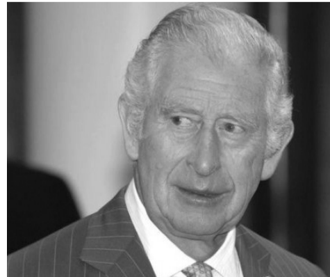
የሳዑዲ አርዳታ ሰጪ የዩኤ ዜግነት እና የከብር ሽልማት ለማስጠት ተሠርቷል በሚል ነው ትችቱ የተጀመረው።

ለጋሹ ሕጋዊ ነው ሲል ድርጅቱ ለሰንደይ ታይምስ ምላሽ ሰጥቷል። አዲሰቸውን ክፍያውን አጽድቀውታል ሲል እክሏል። ለልዑል ቻርለስ የሚደረጉ ድጋፎች በቅርብ ጊዜያት ትችት እያስተናገዱ ይገኛሉ። ለአንድ