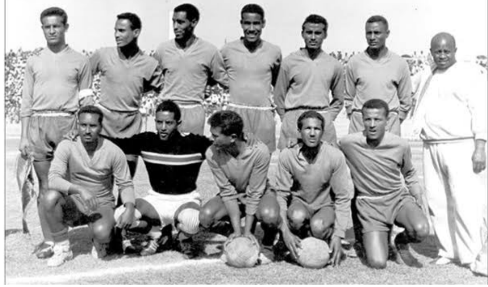
ግዝፈን ከ60 ዓመት በፊት በአፍሪካ ዋንጫ ፍፃሜ 4ስ2 የረታው ታሪካዊው የኢትዮጵያ ብሔራዊ ቡድን።

ኢትዮጵያ፣ ሱዳንና ግብፅ እኤአ 1957 የተጀመረውን የአፍሪካ ዋንጫ ጨዋታ የጠነሰሰና የጀመሩ አገራት በመሆናቸው ታሪክ ይዘከራቸዋል። እኤአ 1956 የኢትዮጵያ የግብፅና የሱዳን ባለሥልጣናት ከደቡብ አፍሪካ ተወካይ ጋር በመሆን የአፍሪካ አህጉራዊ ውድድርን ለመመስረት በፖርቹጋል በነበረው የፊፋ ጠቅላላ ጉባኤ ላይ ተገኙ። የመጀመሪያው የአፍሪካ ዋንጫም እኤአ 1957 በሱዳን መዲና ካርቱም እውን ሲሆን የደቡብ አፍሪካ ፌዴሬሽን ከተለያዩ ዘሮች የተውጣጣ ቡድን ለመለኮ ፈቃደኛ ባለመሆኑ ከውድድሩ ተገለለ። ሶስቱ አገራት ኢትዮጵያ፣ ሱዳንና ግብጽ እየተፈራረቁ ሶስቱን የመጀመሪያ የአፍሪካ ዋንጫዎች በማንሳትም የአህጉሪቱ ሃያል ተፎካካሪ ሆኑ። ይሁን እንጂ የሶስቱ አገራት ሃያልነትና ብርቱ ተፎካካሪነት ዘመናትን የሚሻገር አልሆነም። ሁለቱ ምስራቅ አፍሪካውያን ጎረቤታዎች እንደ ታሪካቸው መራመድ ተሰኝቻቸው ከሰሜን አፍሪካዋ አገር በብዙ ወደ ኋላ ቀሩ። ይህም የአግር ኳስ ደረጃ ልዩነት ዘመናትን ተሻገረ።