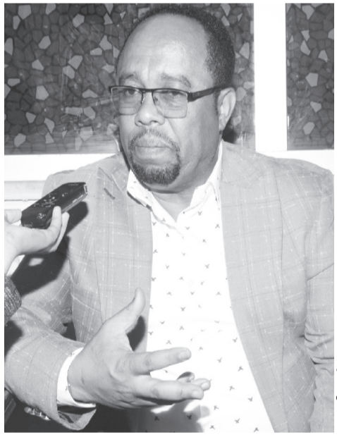
ፎቶ፡ በአዲስ አበባ

ፍላጎታችንን በማቻቻል ሕመማችንን ቁስላችንን በተባበረ መንፈስ በማከም የአገር አንድነትና የክብር ከፍ እንዲል ከመንግሥት ጎን በመሰለፍ የበኩላችንን ድርሻ እንወጣለን ብለዋል።