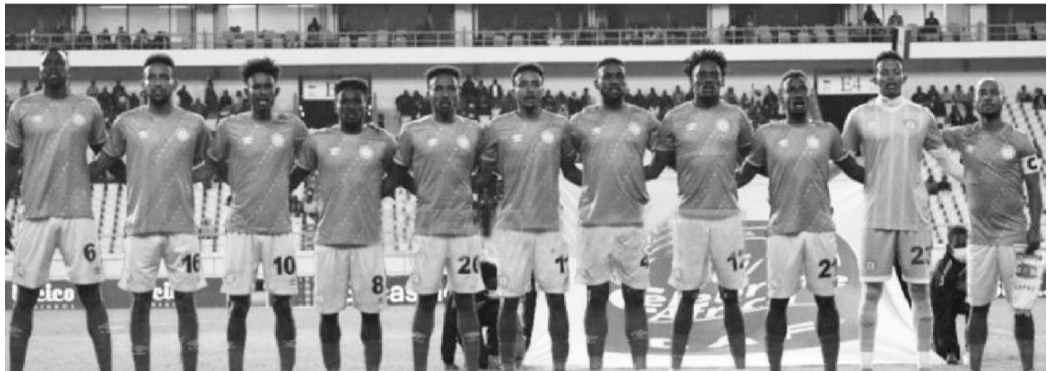
የኢትዮጵያ ብሔራዊ ቡድን(ዋልያዎች) በፊፋ ወርሐዊ ደረጃ ሰንጠረዥ ከዓለም 138ኛ ሆነዋል።

በተያያዘ በሶስት ወርሐዊ የፊፋ የደረጃ ሰንጠረዥ የኢትዮጵያ የሶስት ብሔራዊ ቡድን(ሉሲዎች) ከባለፈው ወር ከነበራቸው ደረጃ ቀንሰው ከዓለም 126ኛ ደረጃ ላይ ሲቀመጡ በአፍሪካ አስራ ስምንተኛ ሆነዋል። ሉሲዎች ከሶስት ሳምንት በፊት በመካከለኛና ምስራቅ አፍሪካ ዋንጫ(ሴካፋ) ወደ ዩጋንዳ ተገዘው በሶስተኛነት