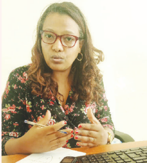
ዶክተር ሀሊማ አባተ

በሀገራችን የጤና መድሀኒት ሥርዓት ባለፉት አስርት ዓመታት ተግባራዊ እየተደረገ እንደሆነ ይታወቃል። የጤና መድሀኒት አገልግሎቱን በማስፋት በ887 ወረዳዎች መድረስ ችሏል። የጤና መድሀኒት ሥርዓት ሀገራችን ሁሉን አቀፍ የጤና ሽፋን ለማረጋገጥ ለምታደርገው ጥረት ዓይነተኛ ማሳሰቢያ መገንድ ነው። የከፍተኛ አስተዳደር ደግሞ በጤና ተቋማት ተጠያቂነትን በማስፈን በዘርፍ ላይ ጥራት ያለው አገልግሎትን እንዲሰፍን በማድረግ የራሱን ሚና እየተጫወተ ይገኛል። እኛም በዛሬ እትማችን በአገልግሎቱ የጤና አገልግሎት ከፍተኛ አስተዳደር የተቋቋመበት ዓላማ፣ ከጤና ተቋማት ጋር ያለውን ቅንጅታዊ አሰራር እና ሌሎች ወቅታዊ ጉዳዮችን በተመለከተ በኢትዮጵያ ጤና መድሀኒት አገልግሎት የጤና አገልግሎት ከፍተኛ አስተዳደር ዳይሬክተር ዶክተር ሀሊማ አባተን አነጋግረናቸዋል። እንደሚከተለው አቅርበናቸዋል።