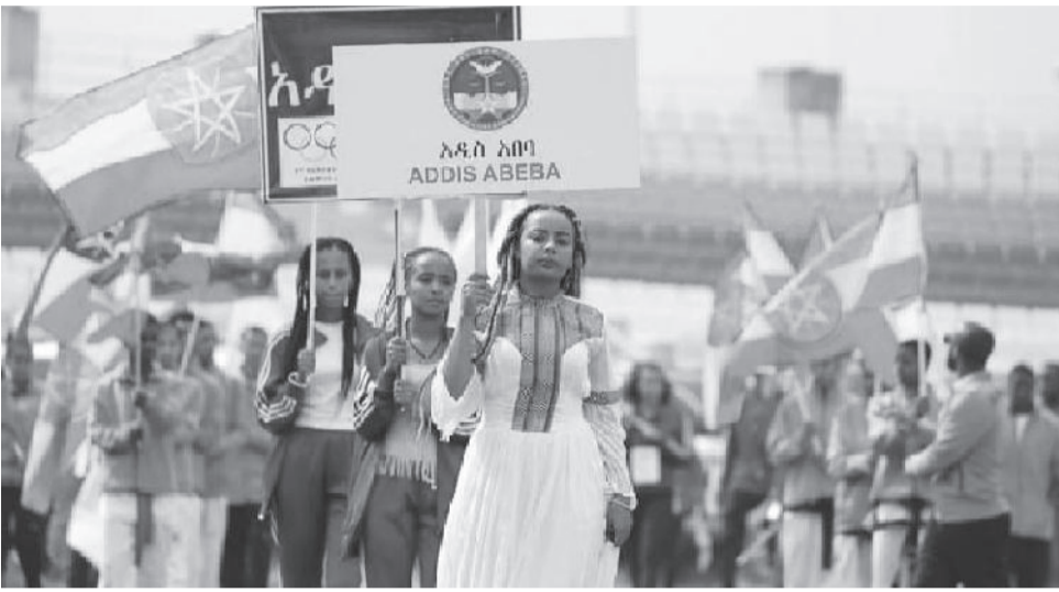
በውጤት ስነ-ምግባር ያጠናቀቁት አዲስ አበባ ቀጣዩን የኢትዮጵያ የወጣቶች ስፖርት ተዘጋጅቶ ተመርጧል።

አዲስ አበባ በአጠቃላይ 44 የወርቅ፣28 የብርና 32 የነጠላ ሜዳሊያ በድምሩ 104 ሜዳሊያ በመሰብሰብ ነው ቀዳሚ ሆኖ ያጠናቀቀችው። የመጨረሻውን የወርቅ ሜዳሊያ ያስመዘገበችውም የአሊምፒክ የመዝገብ መርሐግብር ላይ በተካሄደው የሴቶች እግር ኳስ ፍጻሜ አስተናጋጅ ሲዳማ ክልልን በመለያ ምት በመርታት ነው። አዲስ አበባን ተከትሎ አሮጌያ ክልል በ27 ወርቅ፣23 ብርና 25 ነጠላ በአጠቃላይ በስልሳ አምስት ሜዳሊያ ሁለተኛ ሆኖ ማጠናቀቁን አረጋግጧል። ደቡብ ክልል በ9 ወርቅ፣13 ብርና 21 ነጠላ በድምሩ በ43 ሜዳሊያ ሶስተኛ ደረጃን ይዞ የሚያጠናቅቅ ሆኗል። ጋምቤላ፣አፋር፣ሶማሊያ ደቡብ ምዕራብ ክልሎች በዚህ የመጀመሪያ የኢትዮጵያ ወጣቶች ኦሊምፒክ አንድም የወርቅ ሜዳሊያ ሳያስመዘገቡ ያጠናቀቁ ናቸው። ከፍተኛ ውጤት ያስመዘገበው የአዲስ አበባ ልኡካን ቡድን ትናንት ወደ አዲስ አበባ ተመልሶም በከንቲባ ጽህፈት ቤት ደማቅ