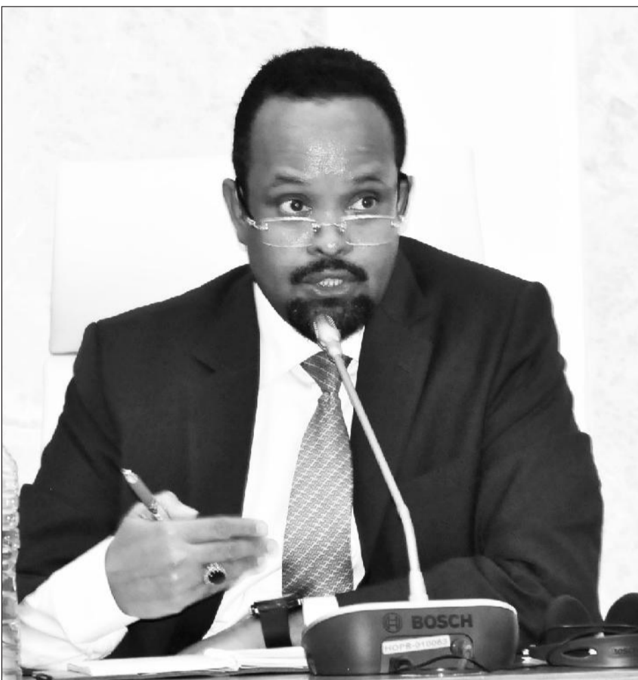
የገንዘብ ሚኒስትር አህመድ ሸዴ

ከግምት ውስጥ ያስገባ በጀት እንደሚሆን ተገምቶ የተዘጋጀ መሆኑ ተገልጿል።