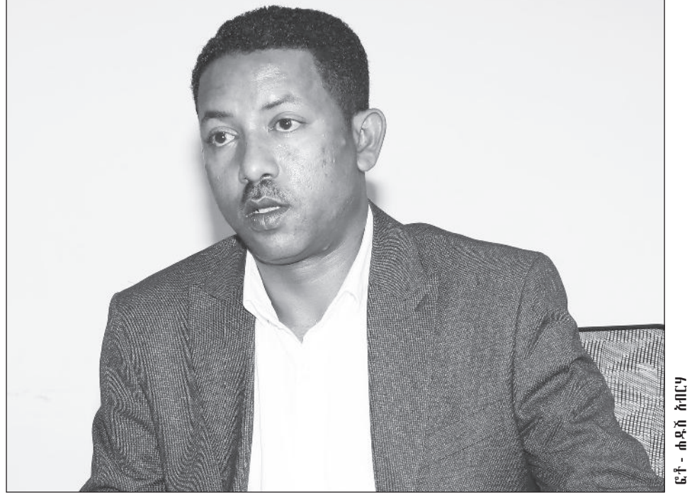
ፌተ - ሐዲስ ስብርባ

የቅርስ ቀን እንደማንኛውም አገር ማክበር ሳይሆን ግንዛቤ ለመፍጠር ትኩረት የተሰጠው ጉዳይ በመሆኑ የቅርስ ቀን ሲከበር ግንዛቤ የሚፈጥሩ መልዕክቶች ተዘጋጅተው እንዲተላለፉ በማድረግ ቀኑ ይከበራል። አሁን ባለው ሁኔታም በርካታ ተንቀሳቃሽ ቅርሶች ከቦታቸው የተወሰዱና የጠፉ በመሆናቸው