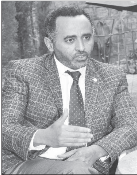
ፌተ - ሐዲስ ስብርባ