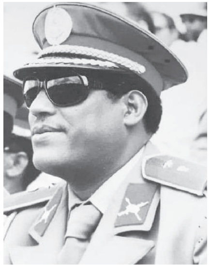
ምክትል ፕሬዚዳንት ሴተናል ኮሎኔል ፍስሐ ደስታ

ክዲስ አበባ፡- የኢትዮጵያ ሕዝባዊ ዲሞክራሲያዊ ሪፐብሊክ/ኢሕዲሪ/ የቀድሞ ምክትል ፕሬዚዳንት ሴተናል ኮሎኔል ፍስሐ ደስታ የቀብር ሥነ ስርዓት በቅድስት ስላሴ ካቴድራል ትናንት ተፈጸመ።