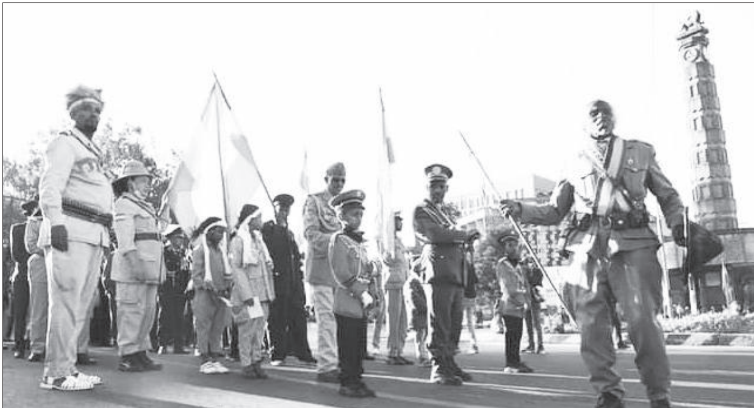
ጀግኖች ኢትዮጵያውያን የፋሽስት ጣልያንን ወራሪ ህይደት ደል ያደረጉበት ሚያዝያ 27 ቀን በየአመቱ እየታሰበ ነው።

በዚህ መሃል እንግዲህ ሁለተኛው የዓለም ጦርነት መቀሰቀስ ለኢትዮጵያ ትልቅ ቦታ ነበረው። ሁለተኛው የዓለም ጦርነት ሲቀሰቀስ ጣሊያን የደቡብ ጀርመን አጋር ሆነች። ያን ጊዜ እንግሊዞች የጣሊያን ጠላት ሆነው ኢትዮጵያን መደገፍ ጀመሩ።