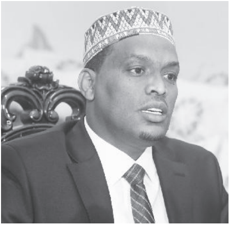
ፎቶ - ጠቅላይ ግንባር