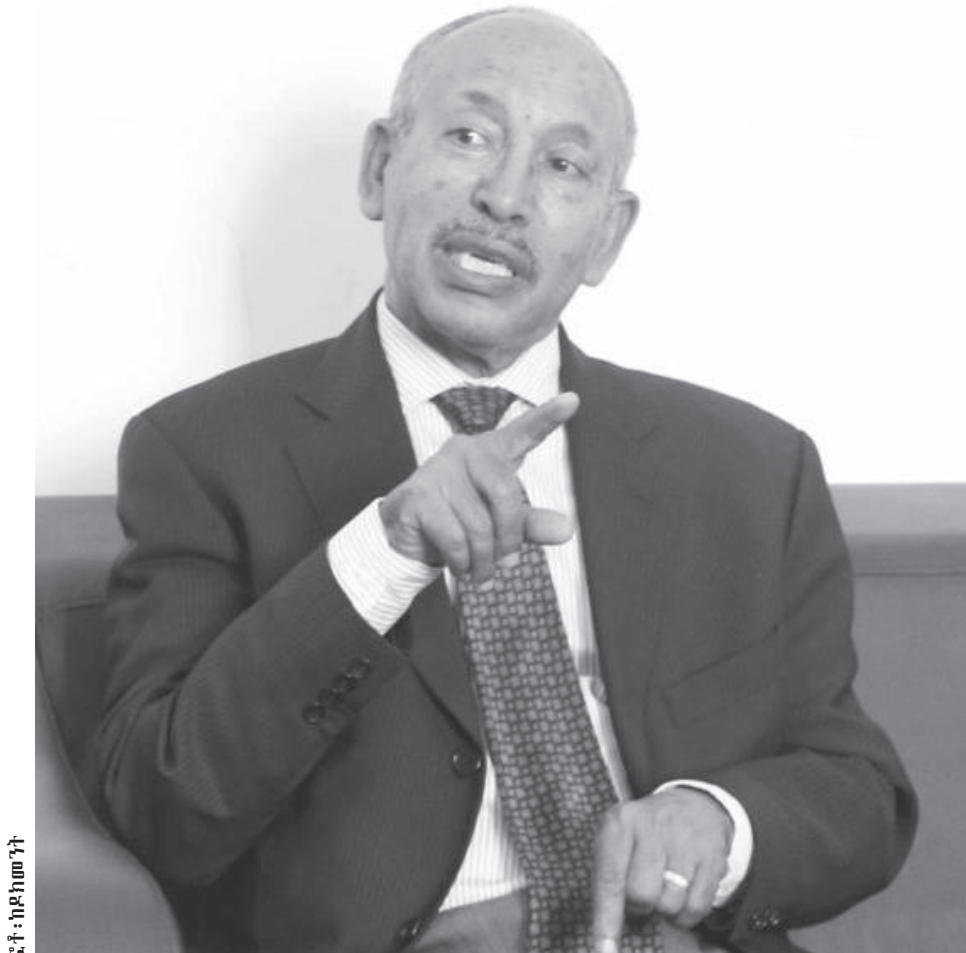
ፎቶ - ከደብዳቤ

ፕሮፌሰር አድማሱ እንደሚሉት፤ በአሁኑ ወቅት መገናኛ ብዙሃን በዚህ መጣ የማይባል የመዋሪያና የማጥቂያ ስልት ሆነዋል። የአንድ ሀገር ውጊያ በጦር መሣሪያና በጦር ሠራዊት ሲሆን አካላዊ ስለሚሆን ለመከላከልም ለማጥቃትም ምቹ ነው። ሚዲያን የተመለከትን እንደሆነ ግን በትንሽ ስከንዶች