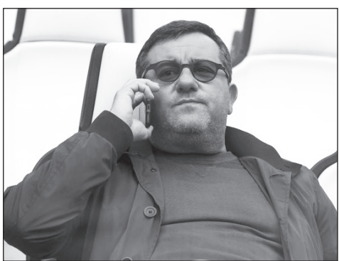
ዘንጃው የእግር ኳስ ተጨዋቾች ደባሳ ሚና ራዮላ በ54 ስመቱ ነው ባለፈው ሳምንት ከዚህ ዓለም በሞት የተለየው።

የፊፋ የተጨዋቾች የዘውውር መስኮት በተከፈተ ቁጥር የታላላቆቹ አውሮፓ ክለቦች ገበያ ሁሉም የስፖርት ቤተሰብን ቀልብ እንደገዛ ነው። ከዚህ የደራ የተጨዋቾች የዘውውር ገበያ ጀርባ ሆነው የሚዘውሩ ሁለት ሰዎች በዓለም ላይ ገና ስም ይዘው መነሳታቸው አይቀርም። ሆኖም ማንደረደው ሚና ራዮላ።