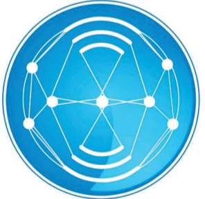
በኢ.ፌ.ዲ.ሪ የመንግሥት ኮሙኒኬሽን አገልግሎት FDRE Government Communication Service

ባታውቅም ጠላቶቻችን አልተኖሩትም፣ አይተኙምም ያለው መግለጫው፣ በሕዝቦቻችን ህብረ-ብሔራዊ አንድነትና በአልገም ባይነት ወይም ሉዓላዊነቷና የሕዝቦች ነፃነት ትውልድ ከዋልታ ... ወደ ገዳ 4 ዞሮል