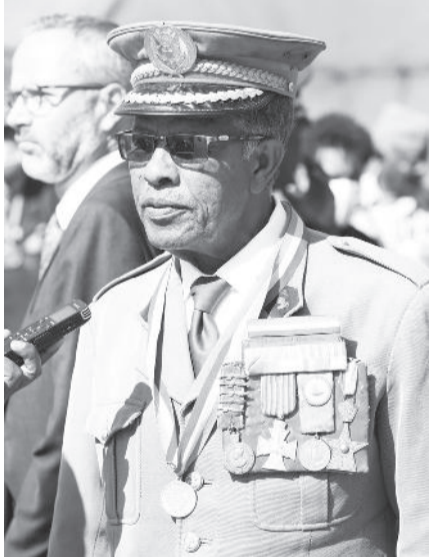
ፊት ላይ፡- አባትና እናት