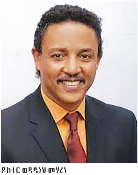
ዶክተር ወዳጅ ነህ መሃረነ

በግላቸው ከሙስሊም አስታዥ ዳደሮቻቸው ጋር በየቦታ ለሙስሊም ምኞት መግለጫ እንደሚለዋወጡ «ሰአገር ሰላምና ... ወደ ገዳ 4 ዞሮል»