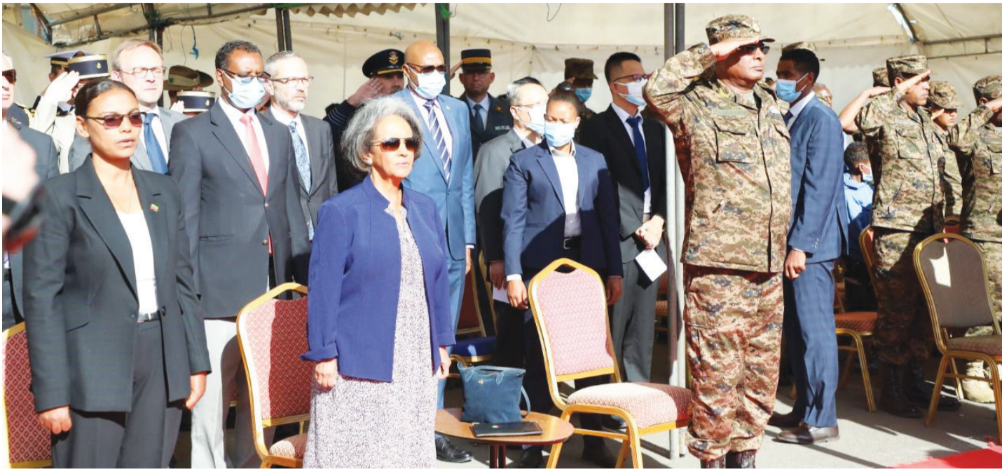
ፎቶ ጻፏ ጎበኛ