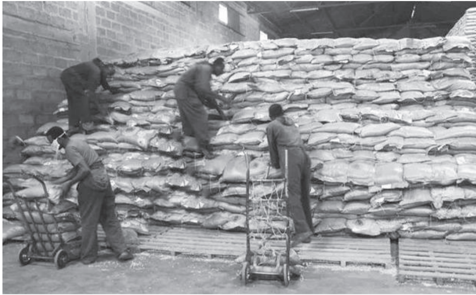
በሌላ በኩል ለመኸር እርሻ የሚሆን ሰው ሰራሽ የአፈር ማዳበሪያ በሀገር አቀፍ ደረጃ እጥረት መከሰቱን ተከትሎ «ኢኮ ግሪን» የተሰኘ ፈሳሽ ማዳበሪያ በአማራጭነት በግብርና ሚኒስቴር እውቅና የተሰጠው በመሆኑ አርሶ

በዚህ ዓመት ለመኸር እርሻ 91 ሺህ 776 ኩንታል የበቆሎ እና 40 ሺህ 687 ኩንታል የሰንዶ ዘር በላቦራቶሪ ተፈትሾ የጥራት ደረጃ ያሟላ እና መለያ ምልክት ተሰጥቶ ለአርሶ አደሩ እየተሰራጨ መሆኑን ተናግረው፤ ተመሳሳሪው ገበያ ላይ ከሚሸጡ የጥራት ቁጥጥር ባልተደረገበት ዘር እንዳይታለሉ አሳስበዋል።