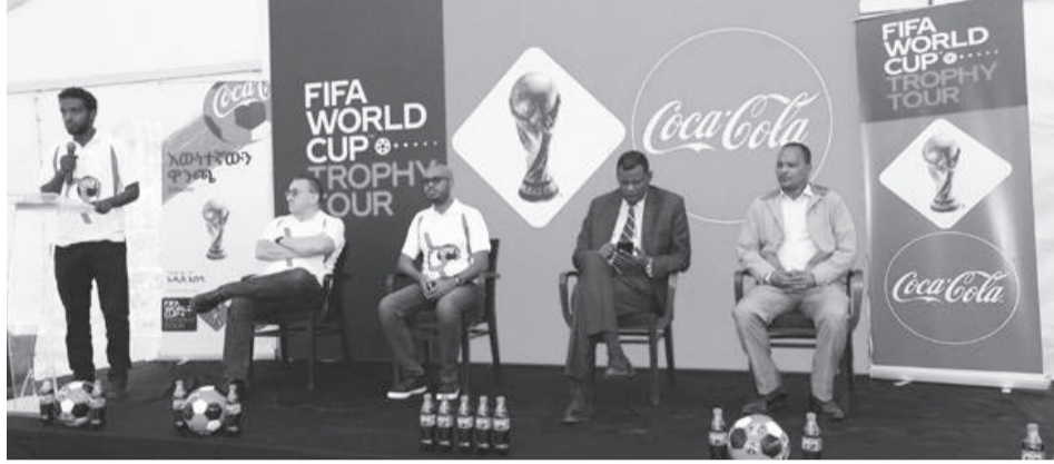
መግለጫው በተሰበሰቡ ወቅት

በአግሮ ኳስ የየትኛውም ኮከብ ሕልምና የመጨረሻ ስኬት የዓለም ዋንጫን ከመሳም የበለጠ ሊሆን አይችልም። ይህ ታላቅ ዋንጫ ትልቅ ከበሬታ ከሚሰጣቸው የስፖርት ሽልማቶች መካከል አንዱ ስለመሆኑም በርካቶች ይሰማማሉ። ይህን ታላቅ ዋንጫ ለማየት ወይም ለመሳም የሚታደሉት ግን እጅግ ጥቂቶች ናቸው። በመሆኑም ይህን ዋንጫ የማየትም ይሁን የመንካት እድል የሌላቸው የዓለማችን አግሮ ኳስ አፍቃሪዎችን ታሳቢ በማድረግ የዓለም ዋንጫ ውድድር በየአራት ዓመቱ በተለያዩ የዓለም ሃገራት ከመካኔዎ አስቀድሞ ዋንጫው በተለያዩ ሃገራት በመዘዋወር የስፖርት ቤተሰቡ ፎቶ አብሮት እንዲነሳ ይደረጋል። በዚህ ዓመትም የዓለም ዋንጫ በኳታር የሚካሄድ መሆኑን ተከትሎ ዋንጫው በተመረጡ አገራት እየተዘዘረ በስፖርት ቤተሰቦች እየተገኘ ይገኛል። ይህን ታላቅ ዋንጫ ለማንሳት ባልታደላቸው አፍሪካም በመጨረሻ ግንቦት ወር አጋማሽ ይመጣል። ኢትዮጵያም ዋንጫው መዳረሻውን ከሚያደርግባቸው የአፍሪካ አገራት አንዷ እንደምትሆን ታውቋል። የዓለም ዋንጫው በአፍሪካ ዘጠኝ ሃገራት ሲዘዋወር መዳረሻውን በኳታር ዓለም ዋንጫ ተሳታፊ በሆኑ አምስት ሃገራት ያደርጋል። ሴኔጋል፣ ሞሮኮ፣ ጋና፣ ካሜሮን እና ቱኒዲያ የዓለም ዋንጫው ተሳታፊ እንደመሆናቸው እድሉን ከሚያገኙት መካከል ናቸው። ኢትዮጵያን ጨምሮ አራቱ ሃገራት ደግሞ በውድድሩ ተካፋይ የማይሆኑ የተመረጡ የዋንጫው መዳረሻ ሃገራት ናቸው። የዓለም ዋንጫው ወደ ኢትዮጵያ ሲመጣ ይህ ለሶስተኛ ጊዜ ሲሆን፣ በመጨረሻ ግንቦት 16 እና 17/2014 ዓ.ም የሁለት ቀናት ቆይታ ይኖረዋል። በዚህ መርሐ ግብር