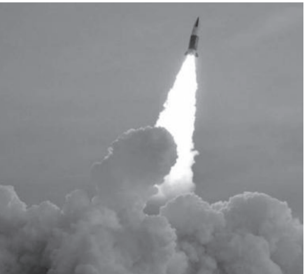
የሰሜን ኮሪያ ባላስቲክ ሚሳኬል

የሰሜን ኮሪያው መሪ ኪም ጆንግ ኢን ከቀናት በፊት በተከበረው የአገሪቱ ጦር ኃይሎች ምስረታ ቀን ላይ