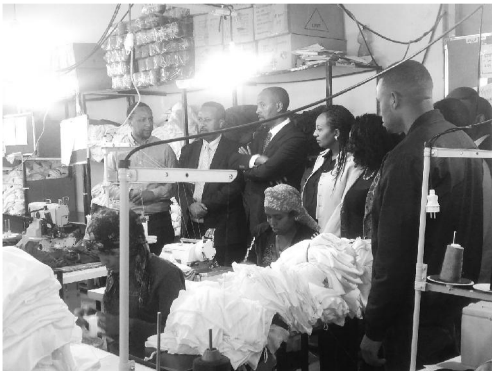
በአዲስ አበባ የሚገኙ ኢንዱስትሪዎች በከተማ አስተዳደሩ የስራ ሀሳቦች ተገብኝተዋል።