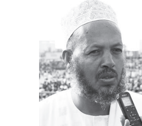
ሺህ መከተ ሙሄ