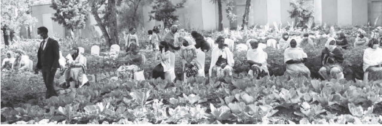
ፎቶ ጻፏች ስብረ