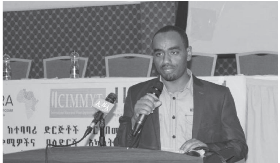
ዶክተር አሳምነው ተሾሙ

በመምጣቱ የመጪው ክረምት ዝናብ ሁኔታ ከፍተኛ ጎርፍ ሊያስከትል የሚችል መደበኛና ከመደበኛ በላይ የሆነ 85 በመቶ የሀገሪቷ አካባቢ የሚሸፍን ስርጭት እንደሚኖርም መጠቀሱን አይዘግብም።