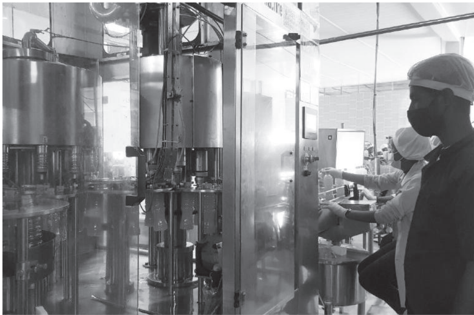
የአፍራን ግሎባል ቢዝነስ የጁስ ማምረቻ ኢንዱስትሪ የማምረት ሂደት

ከአካባቢው አምራቾች ጋር ያለውን የገበያ ትስስር ለማጠናከር እንዲረዳው የፋይናንስ ተቋማትን ድጋፍ