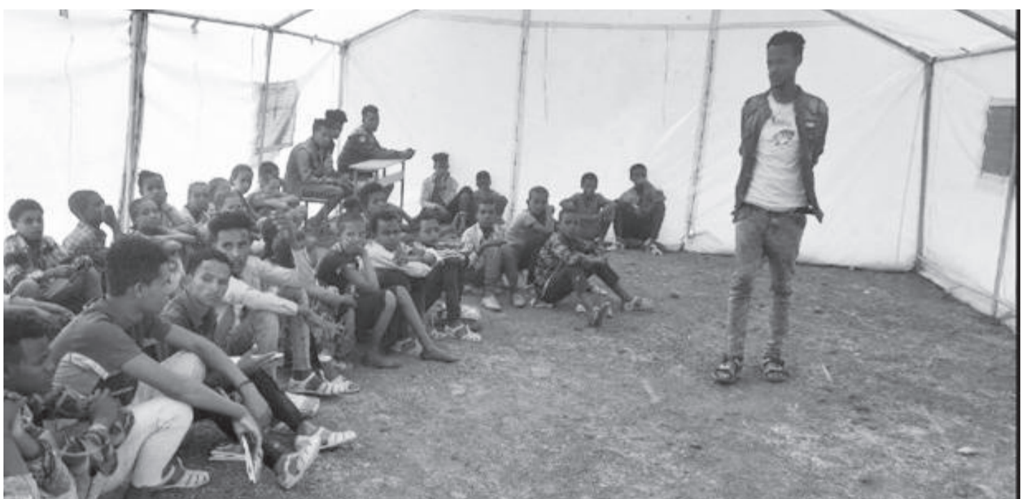
ተፈናቃይ ተማሪዎች በድንኳን ውስጥ ትምህርታቸውን እየተከታተሉ ይገኛል