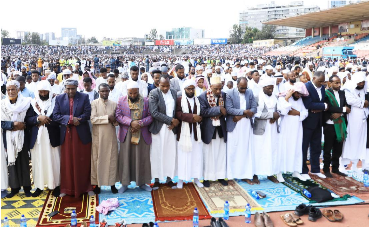
ፎቶ - ሃዲስ አበባ

81ኛ ዓመት ቁጥር 235 ሚያዝያ 25 ቀን 2014 ዓ.ም ዋጋ 10.00 ብዕራችን ለኢትዮጵያ ህዳሴ ይተጋል!