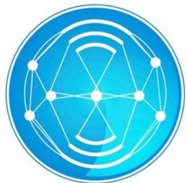
በኢ.ፌ.ዴ.ሪ የመንግሥት ኮሙኒኬሽን አገልግሎት FDRE Government Communication Service

አዲስ አበባ፡- በታሪካዊ የኢትዮጵያ ጠላቶች ሴራና በውስጣዊ ባንዳዎች ተባባሪነት ሃገርን የማተራመስ ውጥን እንደማይሳካ የመንግሥት ኮሙኒኬሽን አገልግሎት አስታወቀ። የመንግሥት ኮሙኒኬሽን አገልግሎት ባወጣው መግለጫ እንዳስታወቀው፤ በአዲስ አበባ የታላቁ ዒድ ሰላት ላይ በተፈጠረ ችግር በኅብረት እና በፀጥታ ኃይሎች ላይ ከደረሰው መለስተኛ ጉዳት ውጭ በአብዛኞቹ የሃገሪቱ አካባቢዎች የ1443ኛው ኢድ አልፎ ጥር በዓል ሰላት በደማቅ ሁኔታ ተካሂዶ በሰላም ተጠናቋል። የውስጥ ባንዳዎች በሃይማኖት ሽፋን ከውጭ ኃይሎችና ከታሪካዊ ጠላቶች ጋር ተቀናጅተው ማግባራት