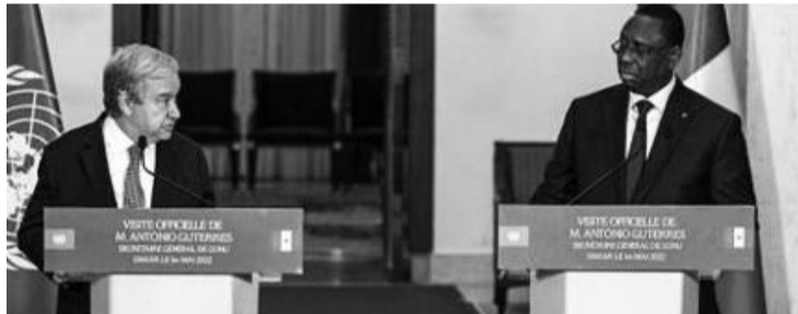
የተመድ ዋና ጸሐፊው አንቶኒዮ ጉቶሬዝ እና የሴኔጋል ፕሬዚዳንት ማኪ ሳል

ግለሰቡ ግድያውን መፈሰሰን በማመንም በሎዴርዴል ካውንቲ እስር ቤት ውስጥ የፍርድ ሐረቶችን እየተጠባበቀ ሳለ መጥፋቱንም ባለሥልጣናት ገልጸዋል።