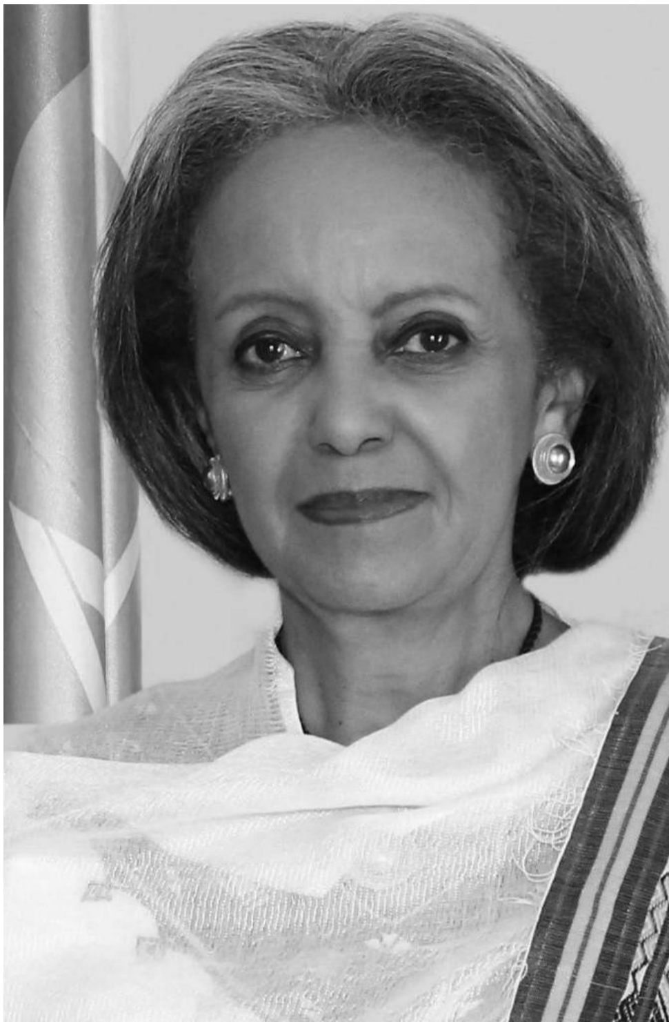
የመጀመሪያዋ የኢ.ፌ.ዴ.ሪ ሴት ፕሬዚዳንት አምባሳደር ሳህለወርቅ ዘውዴ

ፈጣሪነታቸው ተረጋግጦ ዕውቅናን ማግኘት ከቻሉት ሴቶች መካከል የኢ.ፌ.ዴ.ሪ ፕሬዚዳንት ሆነው አገርና ሕዝባቸውን እያገለገሉ ሥላሴት ፕሬዚዳንት ሳህለወርቅ ዘውዴ የተወሰኑ ልንገራቸው ወደድን። አምባሳደር ሳህለወርቅ ዘውዴ በወርሃ የካቲት 1942 ዓ.ም በአዲስ አበባ ከተማ ውስጥ ነው የተወለዱት። የመጀመሪያ እና የሁለተኛ ደረጃ ትምህርታቸውን ያጠናቀቁት በሊሲ ገብረማርያም ትምህርት ቤት ሲሆን፤ የፈረንሳይ ሞንገላል የኒቨርሲቲ የተፈጥሮ ሳይንስ ምሩቅ ናቸው። አማርኛ፣ ፈረንሳይኛ፣ እና እንግሊዘኛ አቀላጥፈው ይናገራሉ። ቁጥር በሌላቸው ዓለም አቀፍ መድረኮች በእነዚህ ቋንቋዎች ንግግር አድርገዋል። አምባሳደሯ ንግግር አዋቂና ብልህ ሴት በመሆናቸው ንግግር ባደረጉበት መድረክ ሁሉ ረጋ ብሎ አረፍተ ነገሮችን እያስረገጡ ጥዑም ዜማ በመላበስ ጥርት ብሎ የሚንቀረቆረው ደምባቸው ሳይሰለቹ እንዲደመጡና ንግግር ባደረጉ ተብለው እንዲናፈቁ ሲያደርጋቸው ቆይቷል። አሁንም እንደዚሁ።