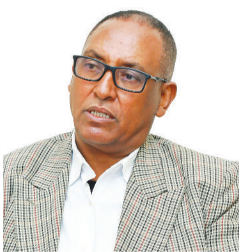
ክት ሲላይ ኃይለማርያም