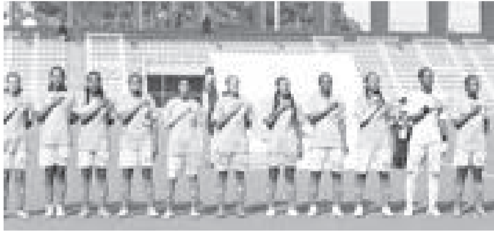
ታዳጊዎች ሱሲዎች ወደ ስንዳ የዓለም ዋንጫ ስማቅናት ከናይጄርያ ስፖርት ጋር የሚያደርጉት ማጣሪያ ብቻ ይቀራል።

በአሰልጣኝ እንዳልካቸው ጫካ እየተሰሩ ከሁለተኛው ዙር ማጣሪያ በኋላ ፉክክሩን የተቀላቀሉት ታዳጊዎች ሱሲዎች በመጀመሪያ የማጣሪያ ጨዋታቸው የጋንዳን በሜዳዋ ገጥመው ሁለት ለሁለት በሆነ አቻ ውጤት ማጠናቀቃቸው ይታወቃል። በመልሱ ጨዋታም በአዲስ አበባ አበበ ቢቄላ ስቴድዮም አንድ ለአንድ በሆነ አቻ ውጤት አጠናቀዋል። ታዳጊዎቹ የጋንዳውን የደርሶ መልስ ማጣሪያ ሦስት ለሦስት በሆነ አቻ ውጤት ቢያጠናቅቁም ከሜዳቸው ውጪ ብዙ ግብ በማስቆጠራቸው ወደ ቀጣዩ ማጣሪያ ሊያልፉ ችለዋል። አራተኛውን የማጣሪያ ውድድር በ2010 እና 2018 የዓለም ዋንጫ ተሳታፊ ከነበረችው ደቡብ አፍሪካ ጋር የተደለደሉት ታዳጊዎቹ ሱሲዎች ከተጋጣሚያቸው አንጻር ልምድ የሌላቸው መሆኑ ብዙ ርቀት ላይጻዙ እንደሚችሉ ስጋት ነበር። ይሁን እንጂ የነበረው ስጋት ከንቱ እንደነበር ደቡብ አፍሪካን በሜዳዋ ጀግንነት ማጣሪያ ላይ ገጥመው ባስመዘገቡት አስደናቂ ውጤት ማረጋገጥ ችለዋል። እነዚህ ታዳጊ ሴቶች ከሁለት ሳምንት በፊት ወደ ደቡብ አፍሪካ አቅንጥው የተሻለ ልምድ ያላትን ደቡብ አፍሪካን ባልተጠበቀ የሦስት ለዜሮ ውጤት በማሸነፍ ከሜዳቸው ውጪ ጣፍጭ ድል ይዘው ተመልሰዋል። ይህም የትናንቱን የአበበ ቢቄላ ስቴድዮም የመልስ ጨዋታ ቀላል አድርጎላቸዋል።