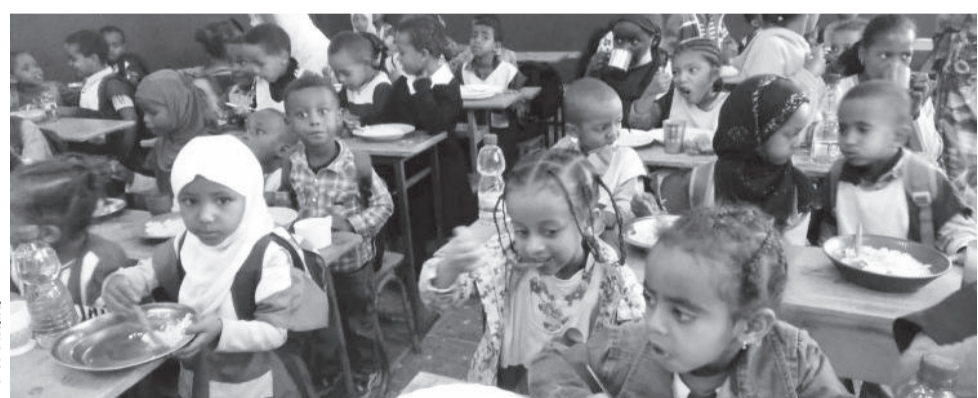
ተማሪዎች በምገባ ላይ

የምገባ መርሃ ግብር ከተጀመረ ወዲህ በአዲስ አበባ ከተማ የትምህርት መጠነ ማቋረጥና መጠነ መድገም በከፍተኛ ሁኔታ ከመቀነስ ባሻገርም በከተማዋ