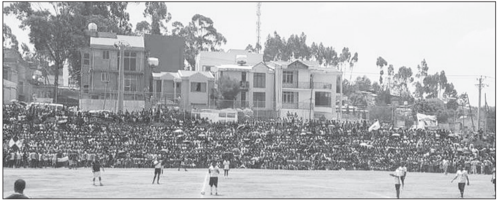
በፈረንሳይ ስፖርት በጨፌ ዞና ስፔይድ የተካሄደውን ውድድር በርካቶች በስፍራው ተገኝተው ተከታትለውታል።

ባለፈው አሁን በአዲስ አበባ ሁለት አንጋፋ ሰፈሮች የተዘጋጁ የውጥቶች የእግር ኳስ ውድድሮች የፍጻሜ ፍልጫዎች ተካሂዷል። በሁለቱም ቦታዎች በብዙ ሺ የሚቆጠር ሕዝብ ተገኝቶ የታደሰ ሲሆን በዙ ገነኛ ሰዎች፣ የመንግሥት ኃላፊዎች፣ አርቲስቶች እና ሌሎችም በክብር እንግድነት ተሳትፈዋል።