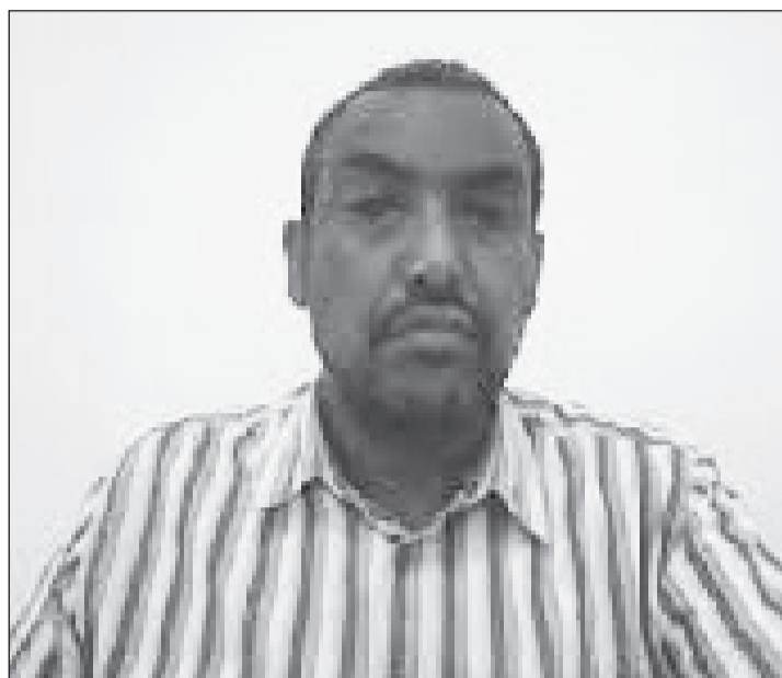
ደክተው ቆሰጠው ገለጻ፤ ገበያውን ጠንካራ ተቋም