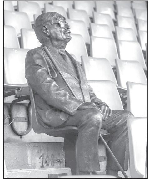
አይነ ስውሩ ደጋፊ በሕይወት ባይኖርም በሚስታላ የዘላለም ሐውልት ቅዋስት ይገኛል።

ቀንደኛ የእግር ኳስ ደጋፊዎች በየትኛውም አለም ሊገኙ ይችላሉ። ከዚህ መካከል ጥቂቶች ቡድናቸው