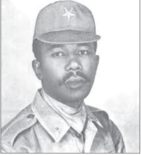
ኮሎኔል መንግሥቱ ኃይለማርያም ከአገር ሰቀው የወጡት ልክ በትናንትናው እስከ 730ት 13 ቀን ነበር።

የመሰረተ ልማት አውታሮችን በተለይ ደግሞ ትምህርትን ለማስፋፋት ከተደረገው ጥረት ባሻገር የእርስ በእርስ ጦርነት፣ እስራትና ስርዓት አልባኝነት የአገዛዙ መለያዎች ሆኑ። በሰሜን የኢትዮጵያ ክፍል