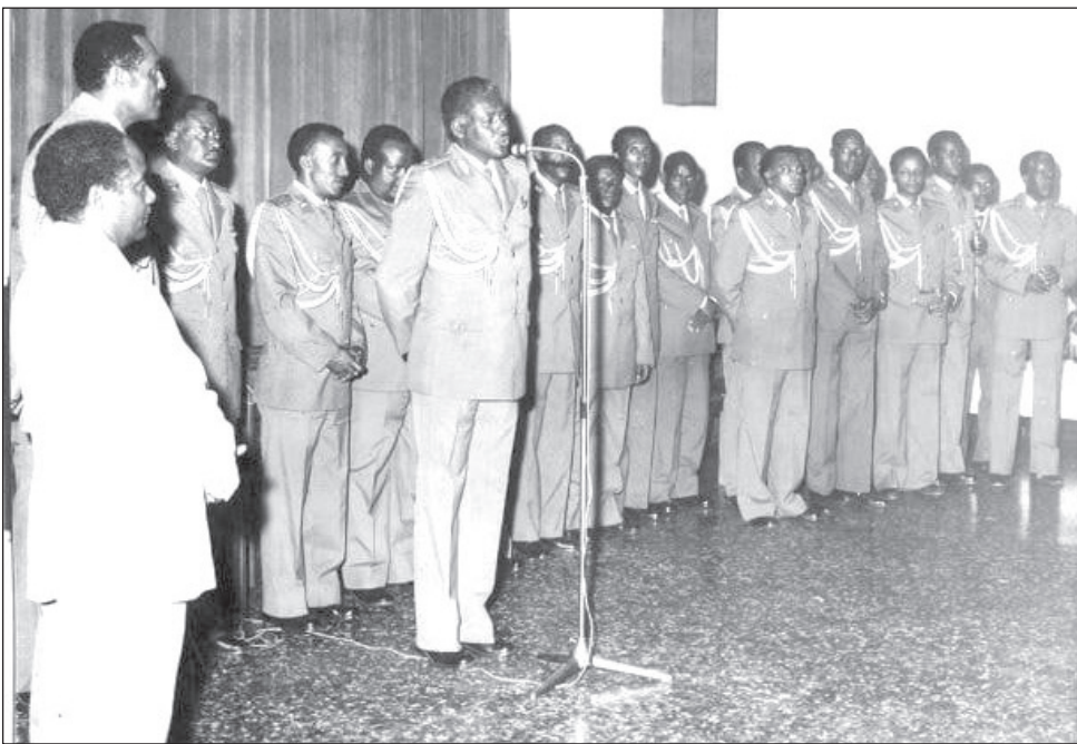
በግንቦት 1981 የመፈንቅለ መንግሥት መከራ በኋላ በተወሰደው አርምዲ ኢትዮጵያ ታላቅ የጦር ጃንሬራል ሻምበል ኢዮብ ላይ ሳምንት ነበር።

ሚጀር ጀኔራል መርዕድ ንጉሤ (የጦር ኃይሎች ጠቅላይ ኤታማጥር ሹም)፣ ሚጀር ጀኔራል ኃይለ ገብረሚካኤል (የምድር ጦር ዋና አዛዥ)፣ ሚጀር ጀኔራል አምሃ ደስታ (የአየር ኃይል ዋና አዛዥ)፣ ሪር አድሚራል ተስፋዬ ብርሃኑ (የባሕር ኃይል ዋና አዛዥ)፣ ሚጀር ጀኔራል ወርቁ ዘውዴ (የፖሊስ ሰራዊት ጠቅላይ አዛዥ)፣ ሚጀር ጀኔራል አብዱላሂ ዐመር (የአገር መከላከያ ሚኒስቴር አስተዳደር መምሪያ ኃላፊ)፣ ሚጀር ጀኔራል ፋንታ በላይ (የኢንዱስትሪ ሚኒስትር)፣ ሚጀር