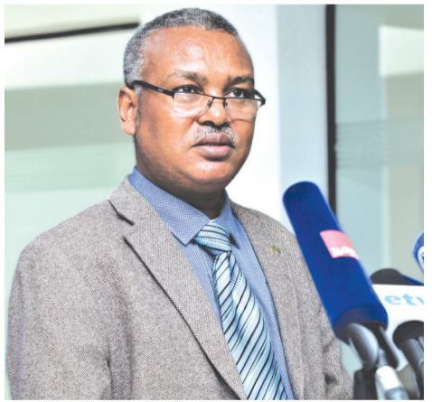
ዶክተር ለገሰ ቱሉ በማንገብ በሚንቀሳቀሱ አካላት ላይ የሚወስደውን እርምጃ አጠናክሮ እንደሚቀጥል የገለጹት ለገሰ ቱሉ (ዶክተር)፤ የግጭት ነጋዴዎች ክድርጊታቸው

አዲስ አበባ:- መንግሥት ለሕዝብ ተቆርቋሪ መስለው አፍራሽ ተልዕኮ በማንገብ በሚንቀሳቀሱ አካላት ላይ የሚወስደውን እርምጃ አጠናክሮ እንደሚቀጥል አስታወቀ። እየተሰተዋለ ያለውን የኑሮ ውድነት ለመቅረፍ መንግሥት የአጭርና የረጅም ዕቅድ ተነድፎ እየተሰራ መሆኑ ተገለጸ። የመንግሥት ኮሙኒኬሽን አገልግሎት ሚኒስትር ዶክተር ለገሰ ቱሉ በአገራዊ ወቅታዊ ጉዳዮች ላይ ትናንት በሰጡት መግለጫ እንዳስታወቁት፤ መንግሥት በመላ አገሪቱ ሰላምን ለማስፈን በሰራው ተግባር በአብዛኛው የአገሪቱ አካባቢዎች አንጻራዊ ሰላም ማስፈን ተችሏል። መንግሥት ለሕዝብ ተቆርቋሪ መስለው አፍራሽ ተልዕኮ በማንገብ በሚንቀሳቀሱ አካላት ላይ የሚወስደውን እርምጃ አጠናክሮ ይቀጥላል። ለሕዝብ ተቆርቋሪ መስለው አፍራሽ ተልዕኮ