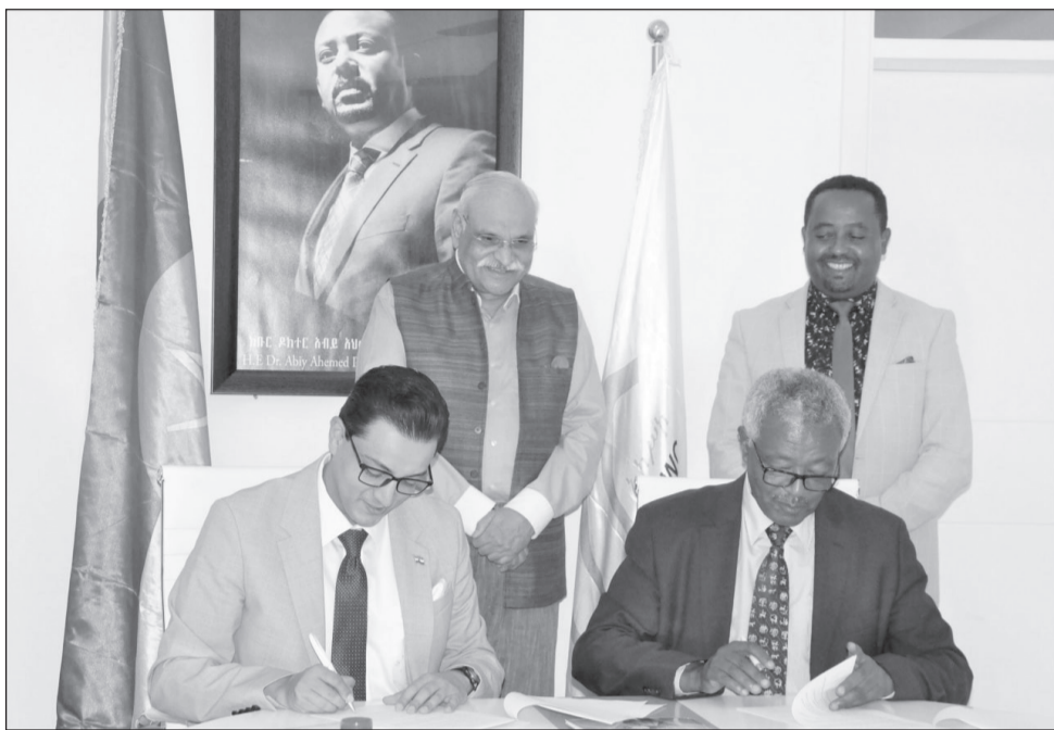
ኮርፖሬሽኑ ከራይዘንግ ሆንግፋ ግሩፕ ጋር የመገባበድ ስምምነት ሲፈራረም

ይህንን የግብዓት ማምረቻ ኢንዱስትሪዎችን የመትከልና ወደምርት ማምረት የማስገባት ግብ እውን ለማድረግ የኮንስትራክሽን ግብዓቶችን በማምረት የዳበረ ልምድ ካለው ራይዘንግ ሆንግፋ ግሩፕ ከተሰኘ የውጪ ኩባንያ ጋር የግብዓት ማምረቻ ፋብሪካዎች ወደ ሃገር ውስጥ ገብተው እንዲተክሉ በቴክኖሎጂ አማራጮችና በተያያዥ ጉዳዮች ዙሪያ ሰፊ ውይይት በማድረግ