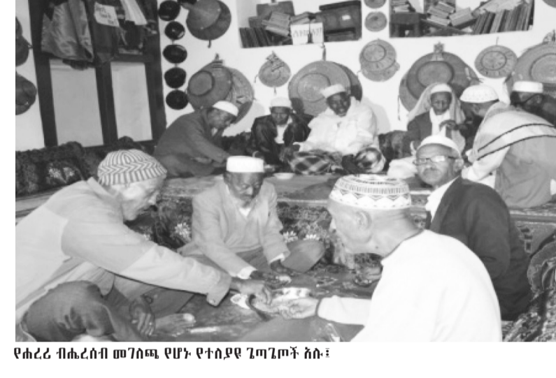
የሐረር ብሔራዊ መጠጦች የሆኑ የተለያዩ ጌጣጌጦች አሉ።

ዙፍት :- የሰንደ ዱቄት ቢጫ ማቅለሚያ (ሲቆ) ተጨምሮበት ከተባካ በኋላ በሰራ ስም ለመጣድ የሚጋገር