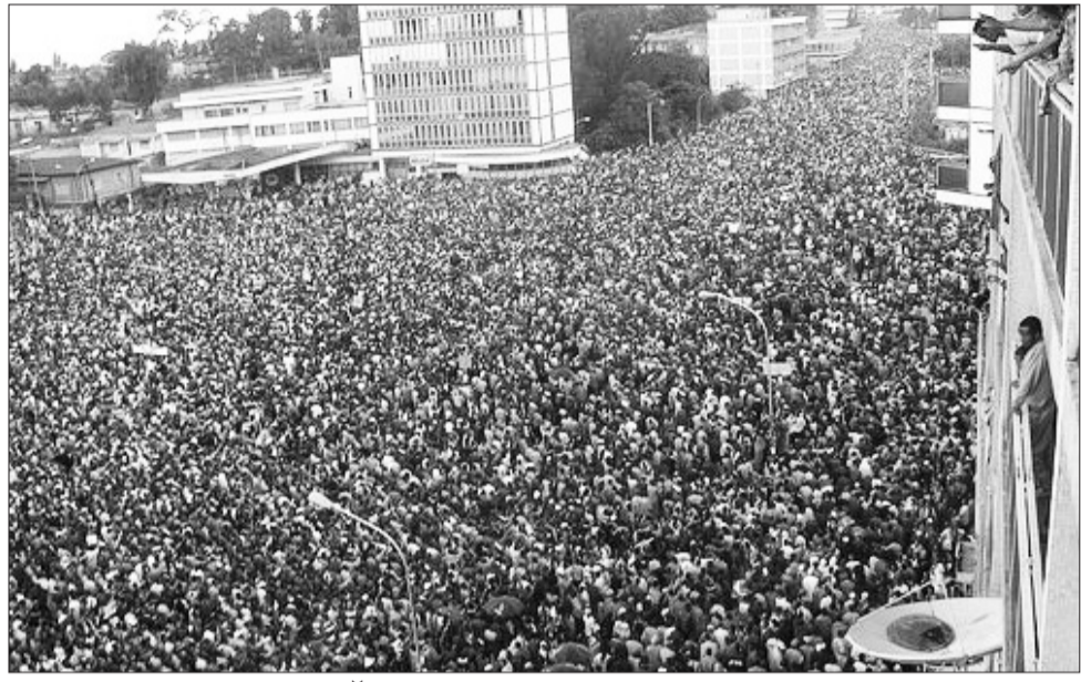
የምርጫ 97 ሰዎችን ገዙፍ የድጋፍ ሰልፎች ታይተውበታል።

የግንቦት 7 ቀን 1997 ዓ.ም ምርጫ ግን የኢትዮጵያ ሕዝብ ከፍተኛ ተስፋ ጥሎበት የነበረ ለመሆኑ፤ የምርጫው