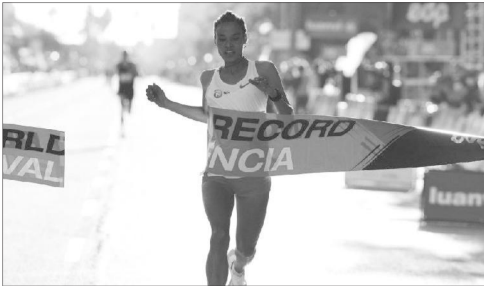
የረጅም ርቀት የወቅቱ ኮከብ አትሌት ለተሰንበት ግደይ የመጀመሪያ የማራቶን ውድድሯን በቫሌንሲያ ስማደረግ ቀጠሮ ይዛለች።

የ2022 የዓለም ትልቁ አትሌቲክስ ቻምፒዮና በአሜሪካ ፖርትላንድ አራገን ከጥቂት ወራት በኋላ እንደሚካሄድ ይታወቃል። የዓለማችን ድንቅ ድንቅ አትሌቶች ለራሳቸው ዝናና ስኬት እንዲሁም ለአገራቸው ክብር አልህ አስጨራሽ ተጋድሎ በሚያደርጉበት የዓለም አትሌቲክስ ቻምፒዮና ለተሰንበትም በአስር ሺ ሜትር እንደምትወዳደር ይጠበቃል። ከዓለም ቻምፒዮናው ጥቂት ወራት በኋላ ግን በረጅም ርቀት ጣፋጭ ድሎችን በተቀዳጀችበት ቫሌንሲያ ከተማ በማራቶን ተጨማሪ ስኬት ለመጎናጸፍ እንደምትዘጋጅ የውድድሩ አዘጋጅች