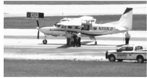
ብሏል በሬዲዮ ባስተላለፈው መልዕክት።

"የአውሮፕላን ከንፎቹን አቅጣጫ አስተካከልና የባሕር ዳርቻውን ተከትለህ ወደ ሰሜን አልፎ ወደ ደቡብ ዝም ብለህ አብርር። እኛ እናገኝሃለን" ሲል የበረራ ተቆጣጣሪው ነግሮት ነበር። አውሮፕላኑን ለማብረር የተገደደው ተሳፋሪ ደግሞ በምላሹ "የአቅጣጫ መቆጣጠሪያውን እንዲያስገኝ አልቻልኩም። እንዴት መቆጣጠር እንደምትችል አላውቅም። እንዴት ማድረግ እንዳለብኝ ልትነግሩኝ ትችላላችሁ?" ሲል ይሰማል። አክሎም "አውሮፕላኑን እንዴት ማቆም እንዳለብኝ አላውቅም። ምንም የማውቀው ነገር የለም፤ እርዳኝ" ብሏል።