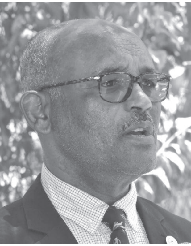
ምክክሩ ተጀምሮ እስኪያበቃ ብርቱና አይተኬ ሚና እንደሚኖራቸው ገልጸዋል።