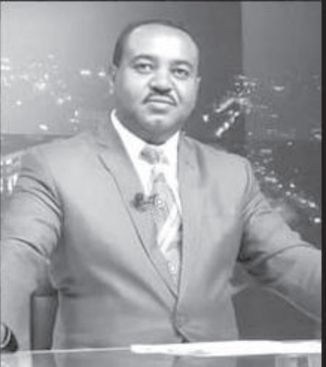
የትምህርት ዝግጅት ሚዲያው ከሚፈልገው ጋር የማይያያዝና ዘርፉን የማይበረታታ መሆን የለበትም። በዚህ ረገድ ችግር ከተፈጠረ አጠቃላይ አሠራሩም አክል ያጋጥመዋል።