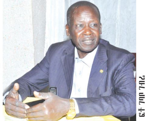
ዶክተር አርካ አቦታ

የልማትና የኖርዲክ ሃገራት ትብብር ሚኒስትር ጋር ውይይት አድርገዋል። የውጭ ጉዳይ ሚኒስትር ዴኤታ አምባሳደር ሬድዋን ሁሴን በኢትዮጵያ ከአሜሪካ አምባሳደር ጋር ውይይት ማድረጋቸውንም ተናግረዋል። እንደ ቃል አቀባይ ገለጻ፣ በኢትዮጵያ ለአውሮፓ ኅብረት ኮሚሽን አምባሳደር በድርቅና በጦርነት ለተጎዱ የኅብረተሰብ ክፍሎች እየተደረገ ስላለው የሰብዓዊ ድጋፍ፣ መንግሥት ለሰላም ባለው ቁርጠኝነት የሠራቸው በጎ ሥራዎች፣ የዜጎች የሰብዓዊ መብት አያያዝን በተመለከተ እየተሠሩ ስላሉ ሥራዎችና ተያያዥ ጉዳዮች ገለጻ የተደረገላቸው ሲሆን ዓለም አቀፍ ማኅበራዊ-በጠቅ ምዕራባውያን ሃገራት... ወደ ገጽ 4 ዞሯል