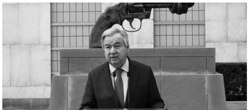
ሪፐብሊክ ኮንገ በተሰማራው የተባበሩት መንግስታት የሰላም ማስከበር ተልዕኮ መካከል “ውጤታማ ቅንጅት” እንደሚያስፈልግ አፅንዖት ሰጥተው መናገራቸውም