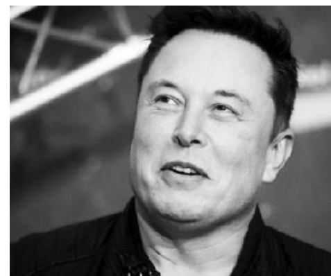
አስመልክቶም ኩባንያው “የመናገር ነጻነት ዳኛ የመሆን ማና በመጫወቱ በርካቶች ደስተኛ አይሆኑም” ብሏል።