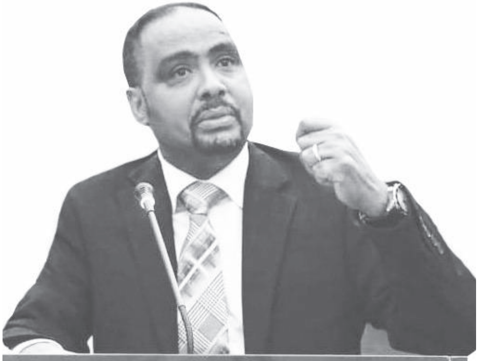
የሆነ የመረጃ ማዘባት ጦርነት እያካሄዱ ነው ብለዋል።

ዲጂታል ወያኔ የዲጂታል ጦርነቱን በተለያዩ መንገድ እየተገበረ ነው። ለአብነትም አርም ሳይሆኑ የአርም ሥም ገፃችን በመክፈት፤ አማራ ሳይሆኑ የአማራ ሥም የያዘ ገፃችን በመክፈት የብሔር ጉዳዮችን አንስቶ በመሰረድና ተቆርቋሪ በመምሰል በሐሰተኛ ገፃችን ተጠቅመው ከፍተኛ