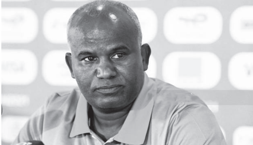
የኢትዮጵያ ብሄራዊ ቡድን ዋና ስራዎች ወ-ቤቱ አባት፤

ኮትዲቯር በታሪክ ለሁለተኛ ጊዜ አዘጋጅ የሆነችበት የአፍሪካ ብሄራዊ ቡድን ለግንባታው ይካሄዳል። ይህን ተከትሎም የአፍሪካ አግር ኳስ ኮንፌዴሬሽን(ካፍ) የዚህን የ34ኛውን የአፍሪካ ብሄራዊ ቡድን ለማግኘት ጨዋታ የምድብ ድልድሉን በቅርቡ ይፋ አድርጓል።