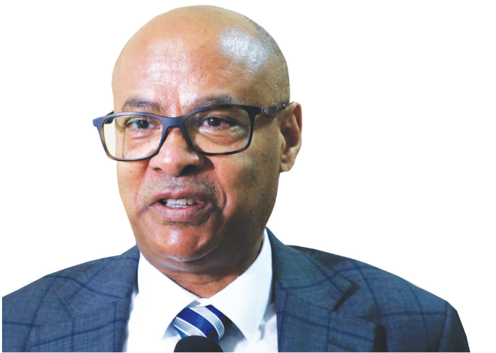
ፕሮፌሰር ጣሰው ወልደሃና