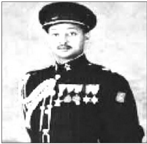
ቤተናል ጆኔራል ጃግማ ኬሎ

ፋሺስት ኢጣሊያ በ1928 ዓ.ም ኢትዮጵያን ስትወር ጃግማ ገና በ15 ዓመቱ አርበኛ ሆኖ የፋሺስትን ጦር ለመፋለም ወሰነ። ከአገቱ ልጅ አሰፋ አባ ዶዮ ጋር ወደ ጫካ ገቡ። እህቱና ወንድሞቹም ተከተሉት። ገበሬዎች፣ ወታደሮች፣ ሾፌሮች ... ከጃግማ ጋር ተቀላቀሉ። አሰፋ አባ ዶዮን ጨምሮ መጀመሪያ ከጃግማ ጋር ለአርበኝነት የወጡ ብዙ ወጣቶች በቤተሰቦቻቸው ተግባራዊ አማካኝነት ከጫካ ወጥተው ወደ መንደራቸው ቢመለሱም ጃግማ ከአርሱ