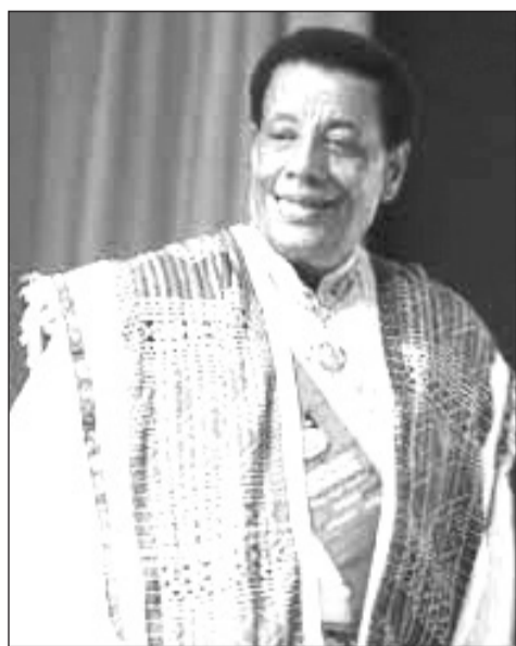
እጅግ የተከበሩ የዓለም ሎሬት ሜትር አርቲስት አፈወርቅ ተክሌ

የጎንደር ፋሲለደስ፣ የሐረር ግንብ፣ የላሊበላ ውቅር አብያተ ክርስቲያናት፣ ቅዱሳት ስዕላት፣ የተወለዱበት አንኮበር የሚገኘው ቤተ መንግሥት የሚያስደንቁ ባህላዊ፣ ታሪካዊ፣ ሃይማኖታዊና አገራዊ እሴቶችን