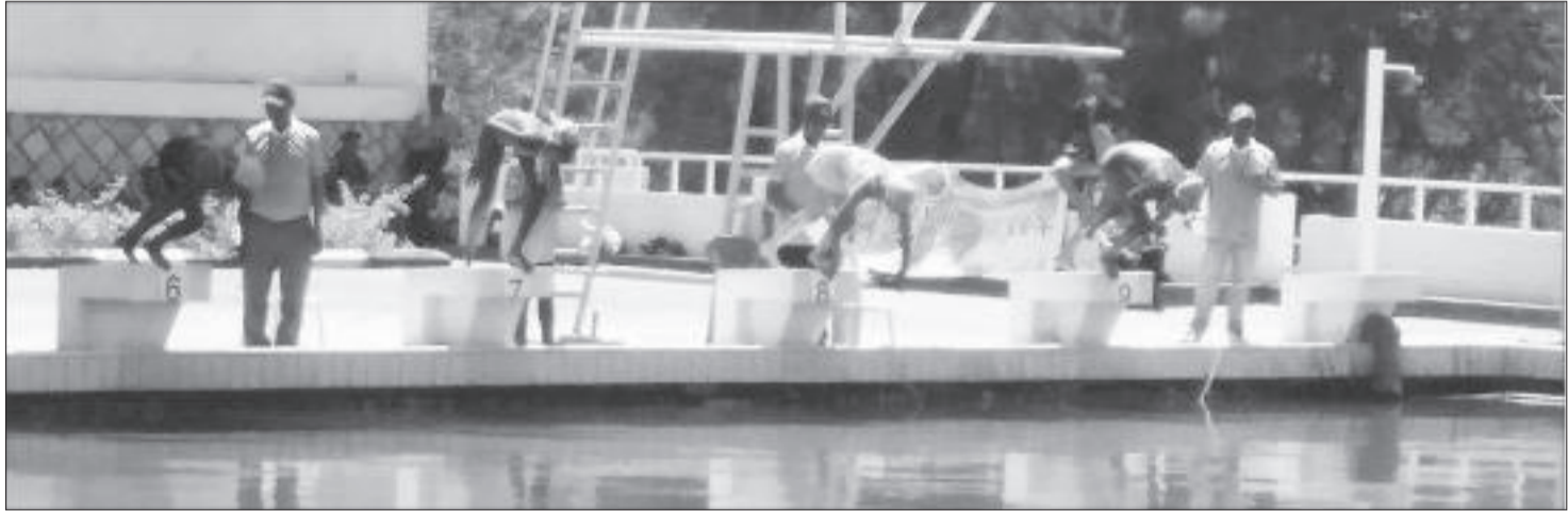
ስለባት ቀናት በሚካሄደው ውድድር ኢትዮጵያን በዓለም አቀፍ መደረኮች የሚወክሉ ዋና ተኞች ይመረጣሉ።

የኢትዮጵያ ውሃ ስፖርቶች ፌዴሬሽን በየአመቱ ከሚካሄዱት ትልልቅ የውድድር መርገግቶች አንዱና ዋናው የሆነው የኢትዮጵያ ውሃ ዋና ቻምፒዮና ከትናንት በስተቀር በቢሾፍቱ ከተማ ተጀምሯል። በመኮንኖች ከባብ የመዋኛ ገንዳ እየተካሄደ የሚገኘው የ2014 ዓ.ም የኢትዮጵያ ክለሶችና ክለሶች ውሃ ዋና ቻምፒዮና በወጣትና ልምድ ባላቸው ዋና ተኞች መካከል በተለያዩ የውድድር አይነቶች ጠንካራ ፍክክር እየሰተናገደ ይገኛል።