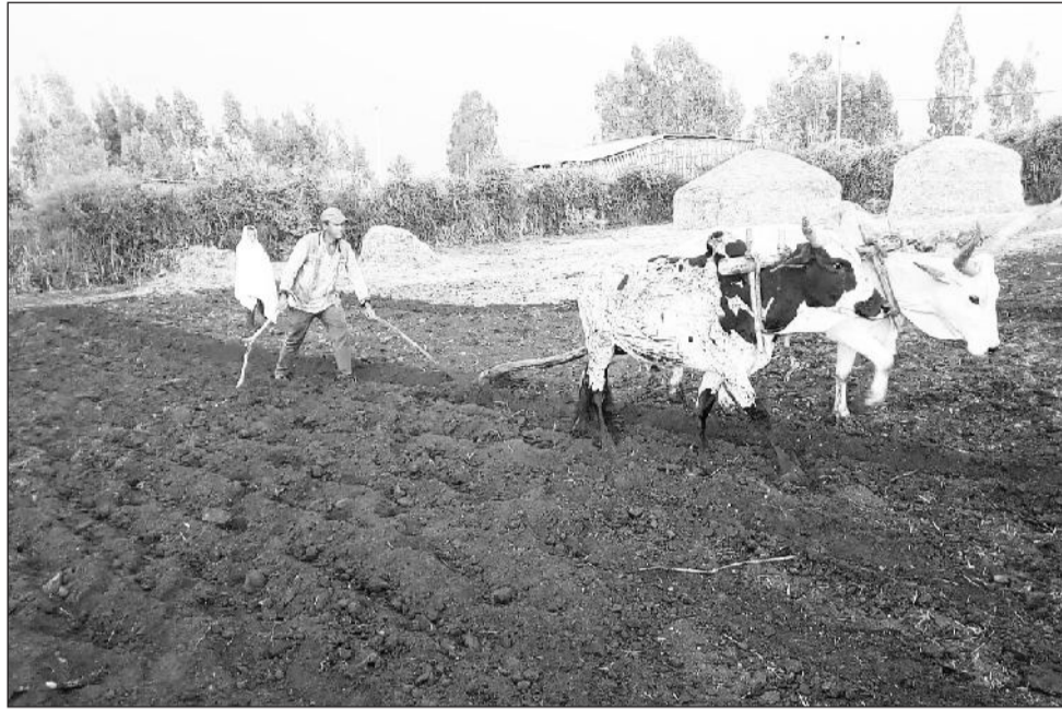
የበልግ ዝናብ ሁኔታ በተፈጥሮ ላይ የተመሰረተ በመሆኑ መጠንና ስርጭቱ ከፍ እና ዝቅ ሲል እንደሚቻል ይጠበቃል።

ሌላው ክልሉ የገጠመው ተግዳሮት የበቆሎ ምርጥ ዘር አቅርቦት አጥረት መሆኑን ኃላፊው ይናገራሉ። ክልሉ ቀደም ሲል የበቆሎ ምርጥ ዘር ከቤኒሻንጉል ጉሙዝ ክልልና ከምዕራብ ወለጋ ነበር የሚያገኘው። በዚህኛው የበልግ የእርሻ ሥራ ከአካባቢዎቹ ማግኘት አልቻለም። እጥረቱ የተፈጠረው የኢትዮጵያን ኢኮኖሚ ለማሸመድ መድ አልሞ የተነሳው የህዝባዊ ወይኔ ሓርነት ትግራይ (ትህነግ) በከፈተው ጦርነት በቤኒሻንጉል ጉሙዝ ክልልና ምዕራብ ወለጋ ውስጥ የነበረው የምርጥ ዘር ግብአት ሙሉ ለሙሉ በማውደሙ መሆኑን ጠቅሷል። ይህም ክልሉ የነበረበትን የበቆሎ ምርጥ ዘር አቅርቦት አስተጓጎሉታል። ክልሉ ቀደም ሲል የያዘውን የበቆሎ